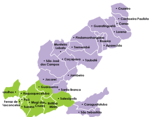
Guaratinguetá - Localização na Região do Vale Paraíba