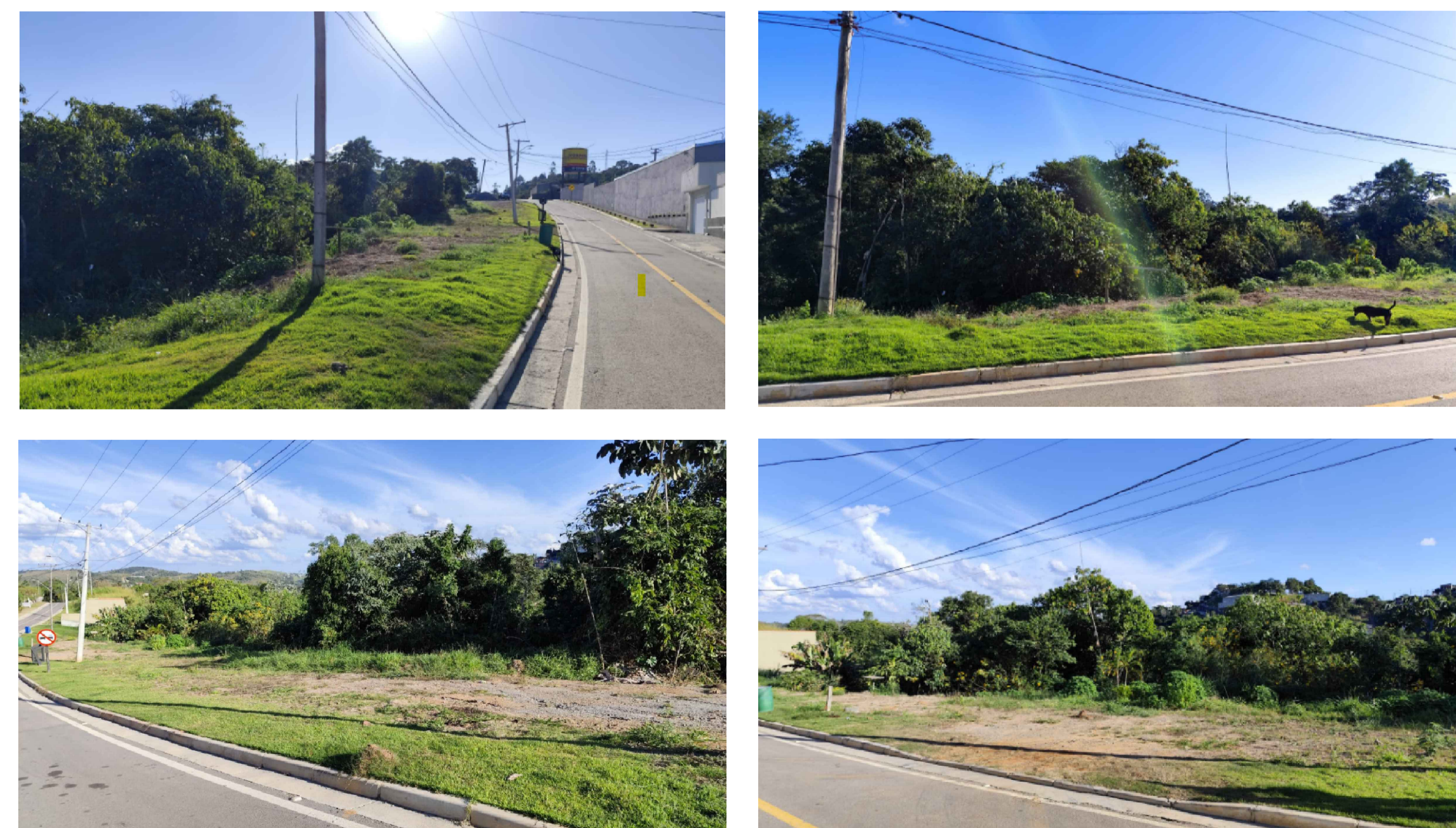
IMAGENS DO LOCAL DE INTERVENÇÃO