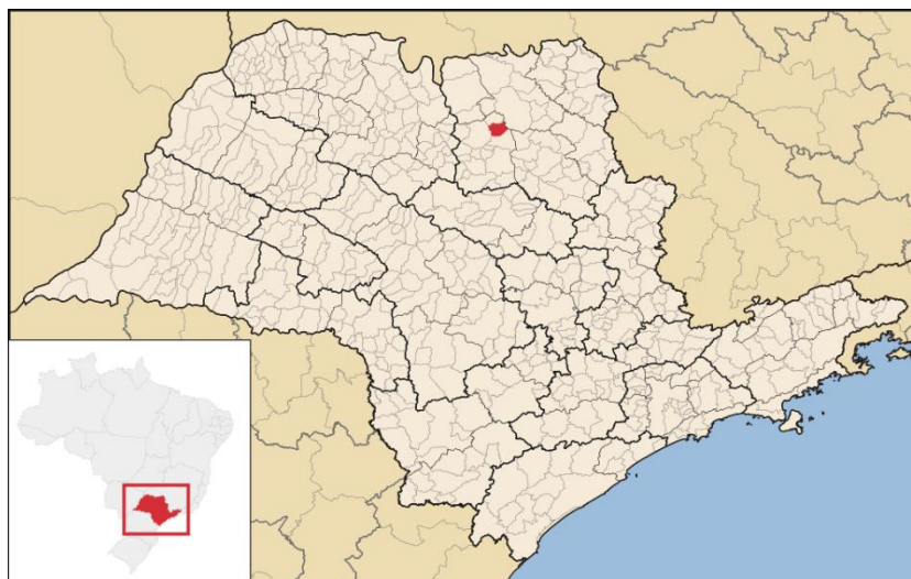
Figura 1: Localização do município de Ituverava.

A Figura 1 apresenta a localização do município no estado de São Paulo.