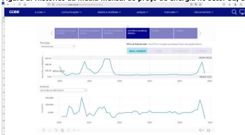
Figura 1: Histórico da média mensal do preço de energia no setor SE/CO