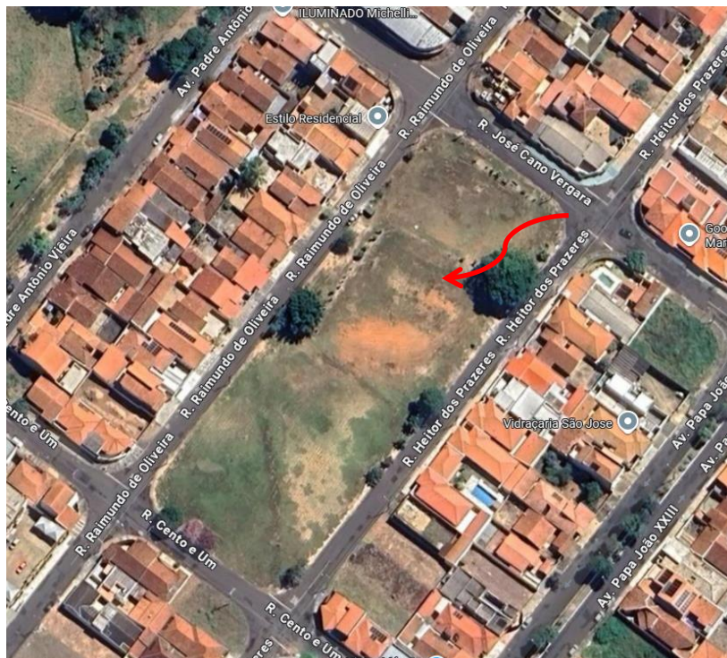
Localização da área institucional

Em conformidade com o artigo 18, § 1º, inciso I, da Lei Federal nº 14.133, de 1º de abril de 2021, e em observância ao artigo 40 do Decreto Municipal nº 11.748, de 15 de maio de 2023, o presente Estudo Técnico Preliminar tem como objetivo primordial especificação a necessidade da contratação de empresa especializada para a construção de uma creche-escola, seguindo o padrão FNDE (Fundo Nacional de Desenvolvimento da Educação), Tipo "1", no bairro Samel Park, região norte do município, entre as Ruas Heitor dos Prazeres, José Cano Vergara Pereira e Raimundo de Oliveira.