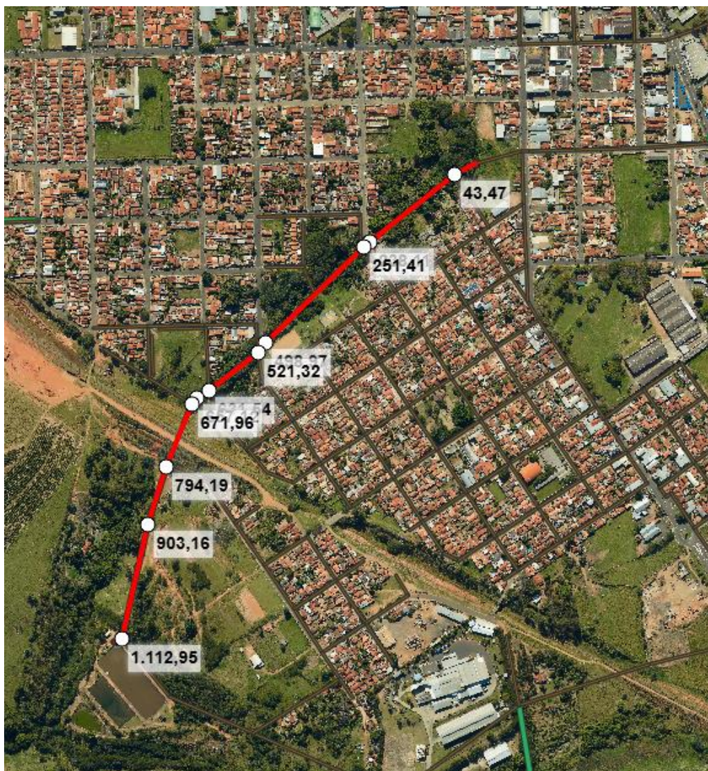
Figura 4: Traçado previsto para execução de novo emissário/interceptor.