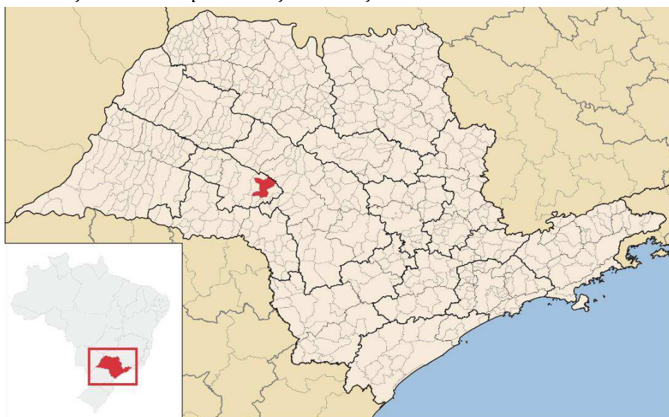
Figura 1: Localização do município de Garça em relação ao estado de São Paulo.

O acesso ao município de Garça, a partir da capital, pode ser feito através da Rodovia Castelo Branco (SP-374), que dá acesso à rodovia Prof. João Hipólito Martins (SP-209) pela saída 210, até o município de Botucatu, seguindo a partir daí pela rodovia Marechal Rondon (SP-300) até o município de Bauru, onde se acessa a rodovia Comandante João Ribeiro de Barros (SP-294) até a saída 415, que dá acesso ao município de Garça. O município se encontra a 413 km de São Paulo.