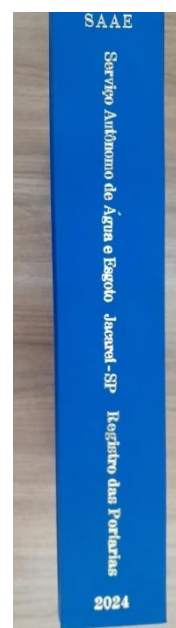
Imagem 4 – Lateral