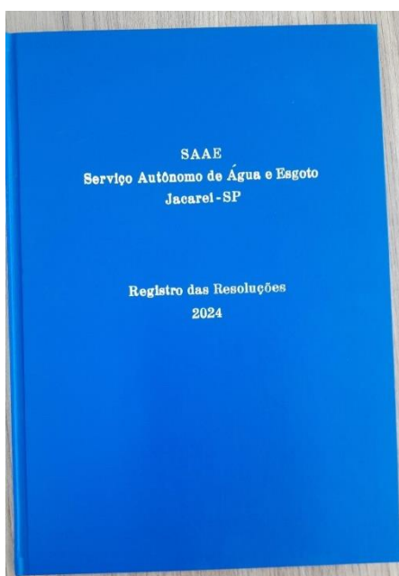
Imagem 3 – Frente