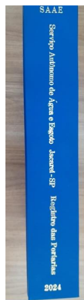
Imagem 2 – Lateral