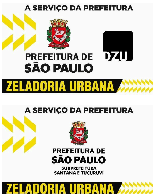
Figura 2: identificação para as portas laterais de veículos/equipamentos.