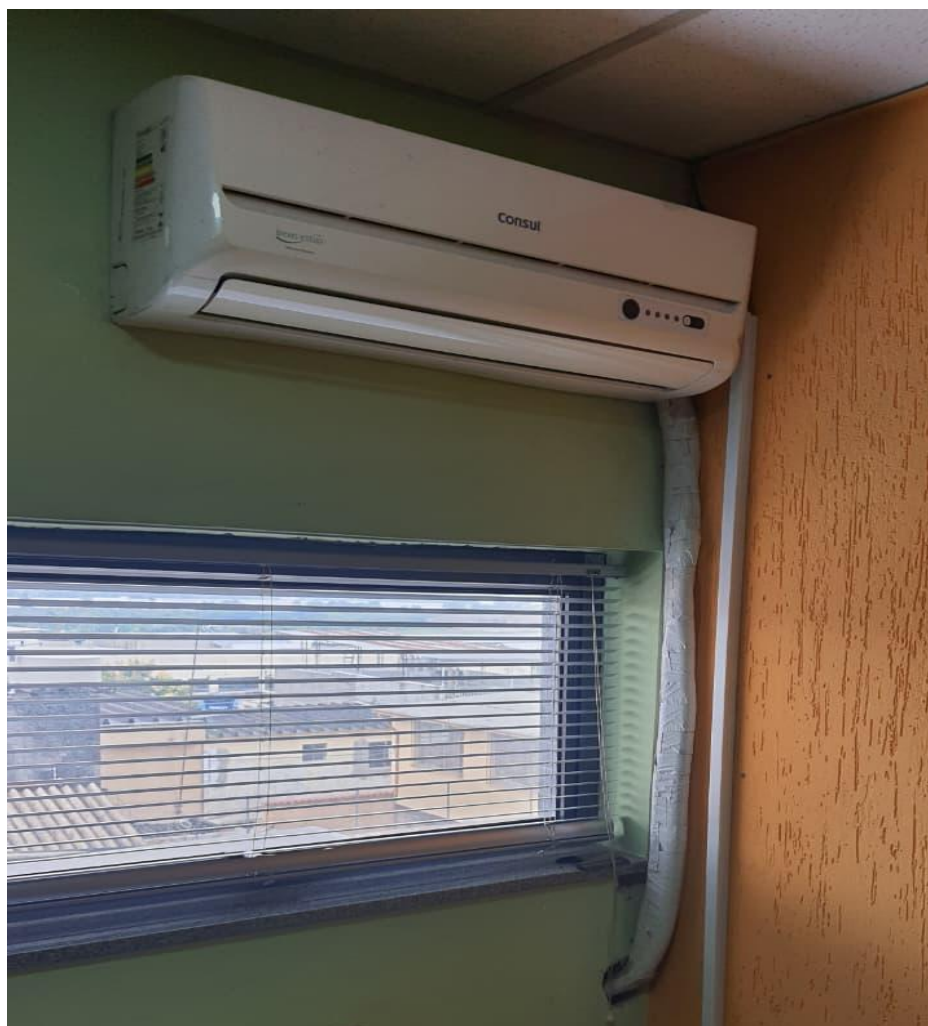
Imagem do local de instalação (interno e externo):

Desinstalação do aparelho antigo; Fixação do aparelho na parede; instalação da bomba de dreno; instalação da parte elétrica; verificação do funcionamento do aparelho para garantia do serviço.