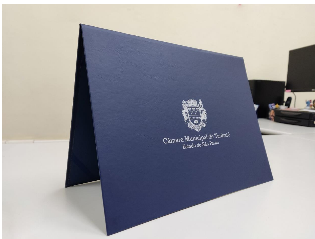
Vistas da pasta em formato "paisagem".

Avenida Professor Walter Thaumaturgo, 208 • Jardim das Nações • CEP 12030-040 • Fone: (12) 3625-9500 camarataubate@camarataubate.sp.gov.br • www.camarataubate.sp.gov.br