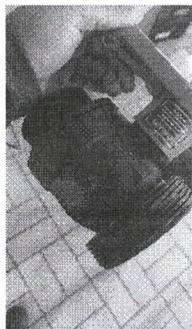
SOL 99-2026 - TUBOS DE MONTAGEM COM FLANGE PARA TANQUE DE PRODUTO QUÍMICO (Foto de referência do Registro).jpeg ~96 KB