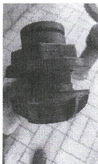
SOL 99-2026 - TUBOS DE MONTAGEM COM FLANGE PARA TANQUE DE PRODUTO QUÍMICO (Foto de referência do Tubo de Montagem).jpeg ~68 KB