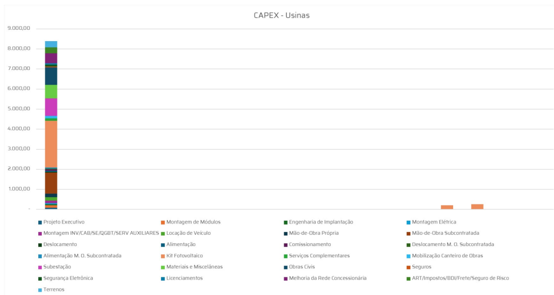
Gráfico 1 - Investimentos ao longo do período de Concessão (R$ mil)