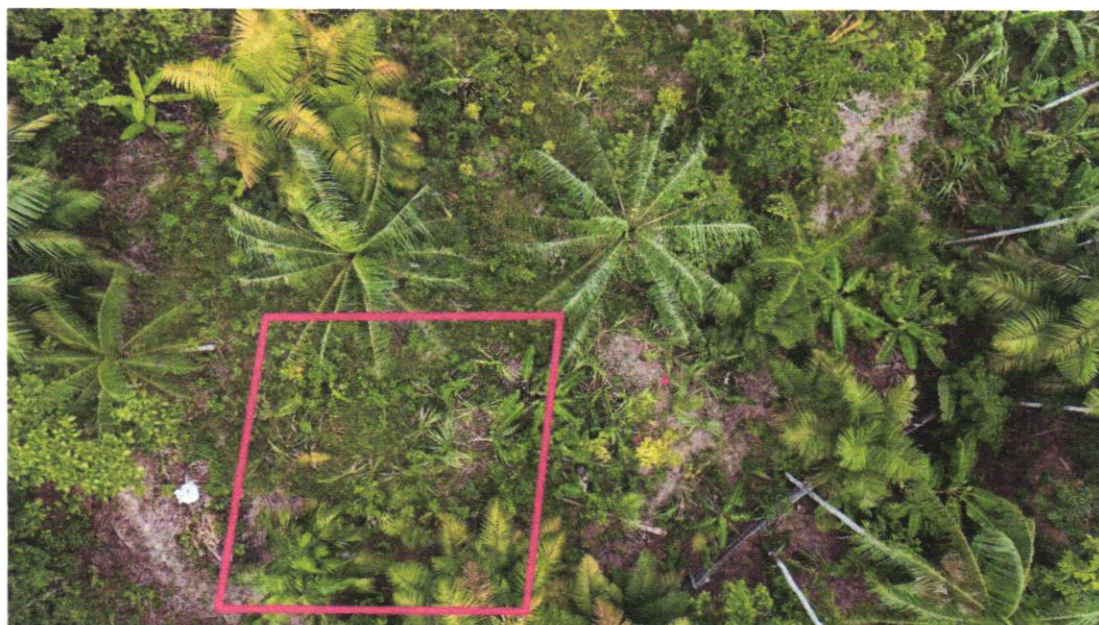
Foto Aérea 01