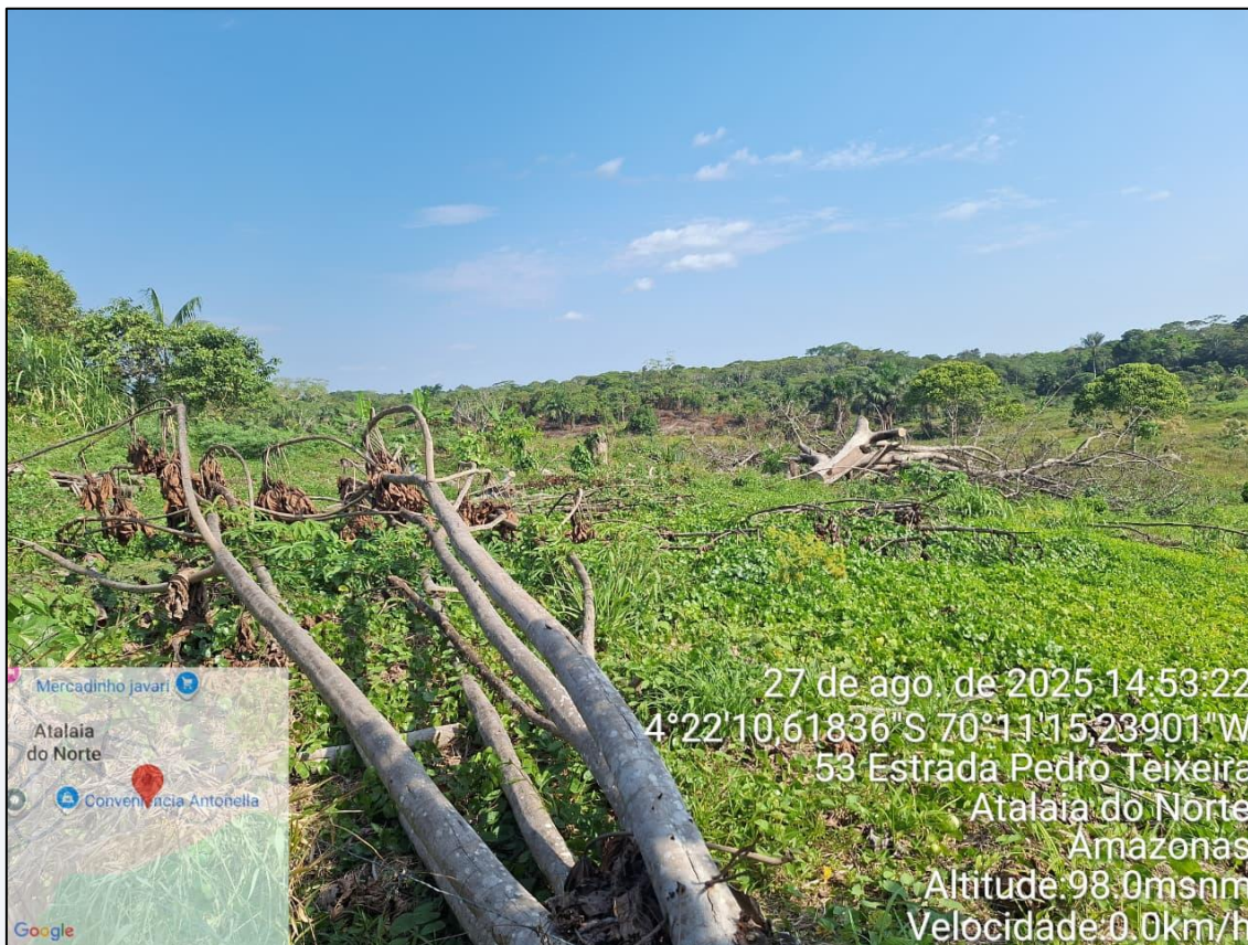
Figura 12-Terreno 03 c