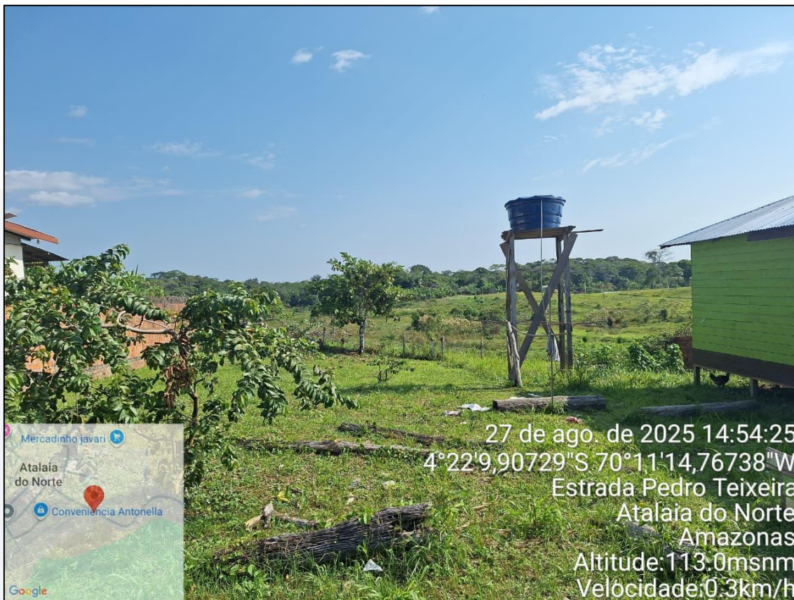
Figura 13-Terreno 03 d