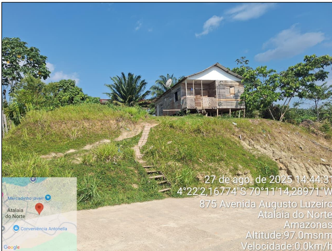
Figura 7-Terreno 02 b