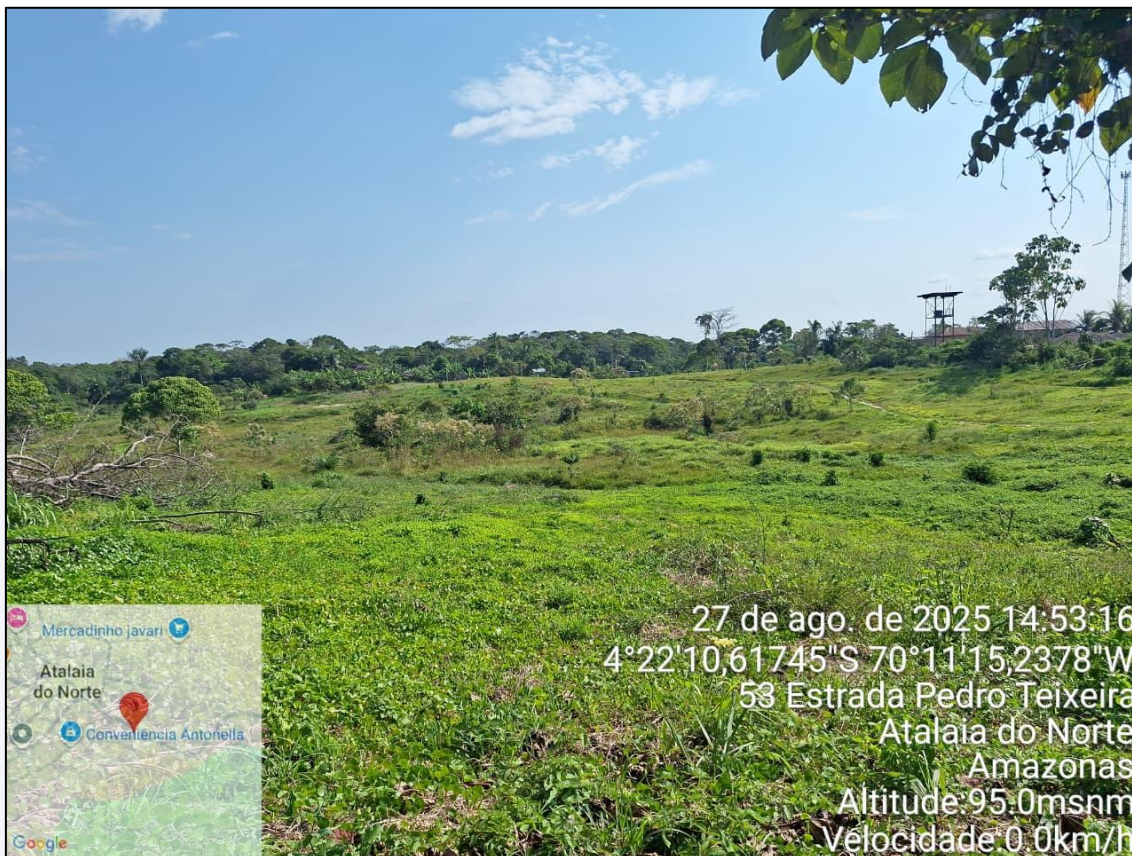
Figura 11-Terreno 03 b