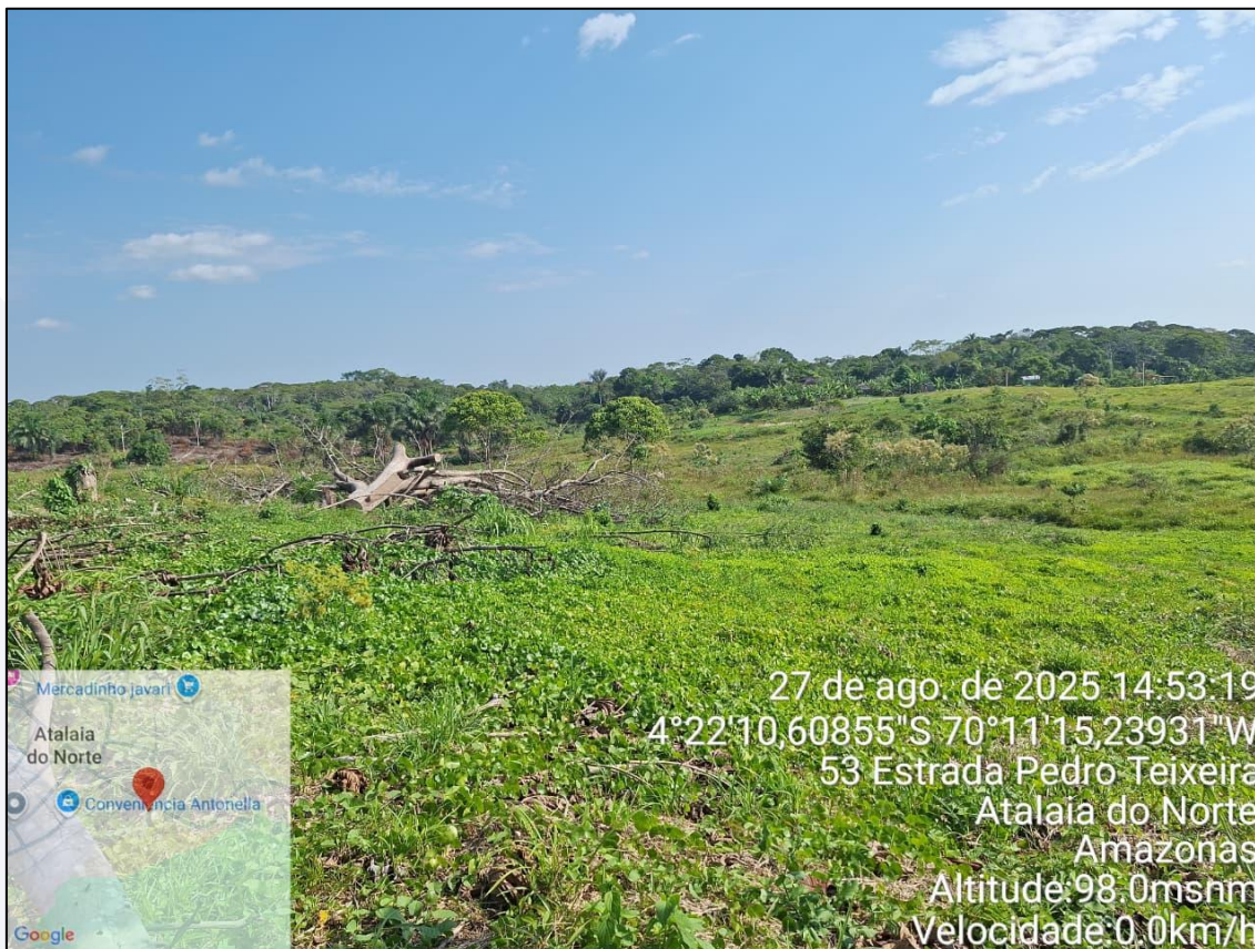
Figura 10-Terreno 03 a