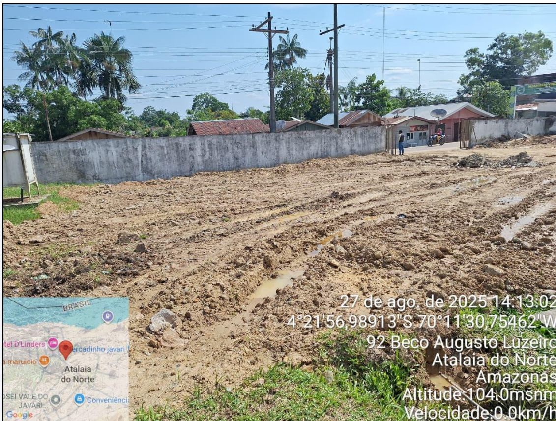
Figura 5-Terreno 01 d