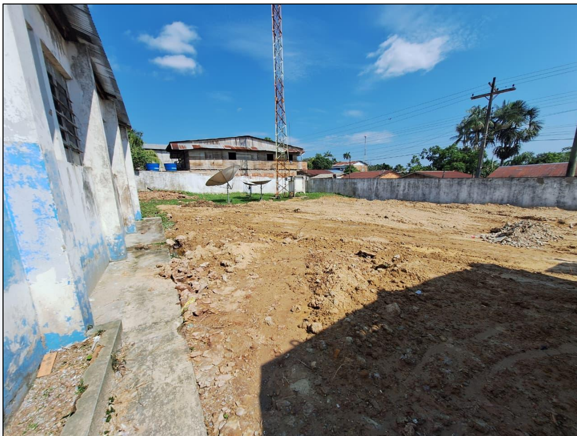
Figura 4-Terreno 01 c

www.cosama.am.gov.br instagram/cosama.am facebook.com/cosama.am