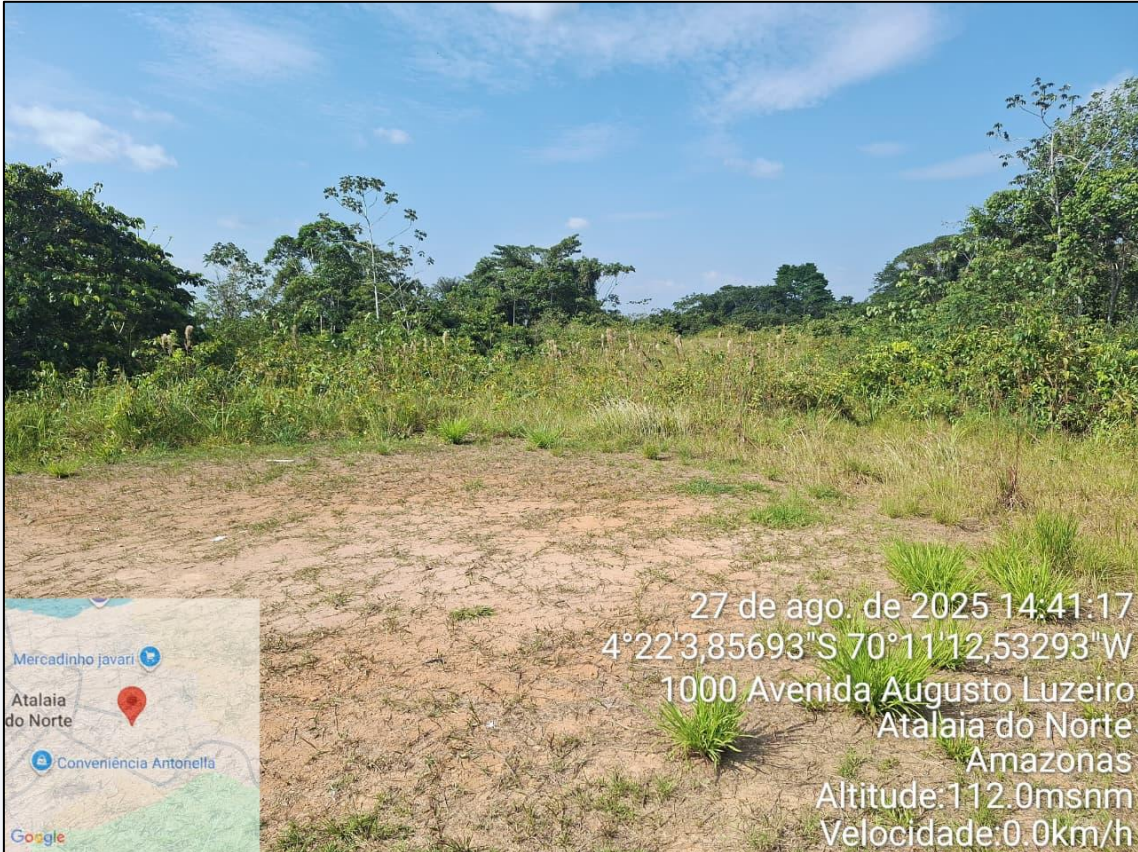
Figura 6-Terreno 02 a