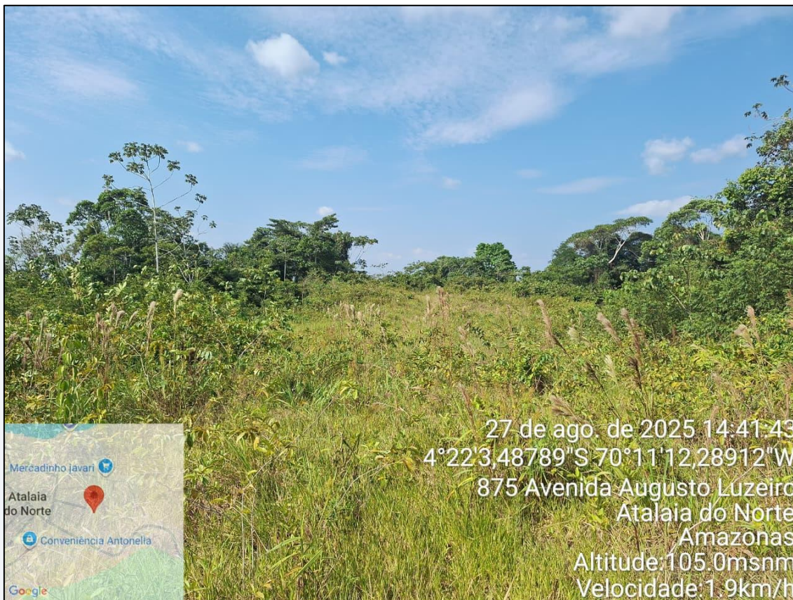
Figura 9-Terreno 02 d