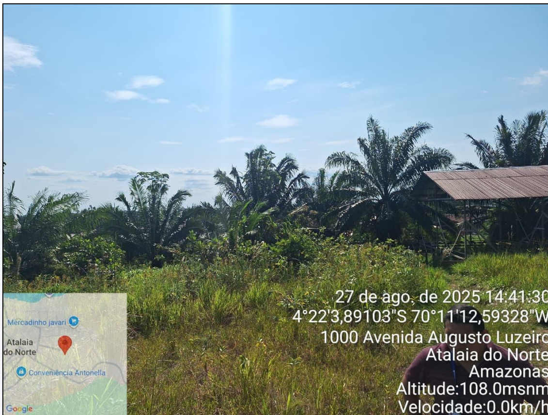
Figura 8-Terreno 02 c