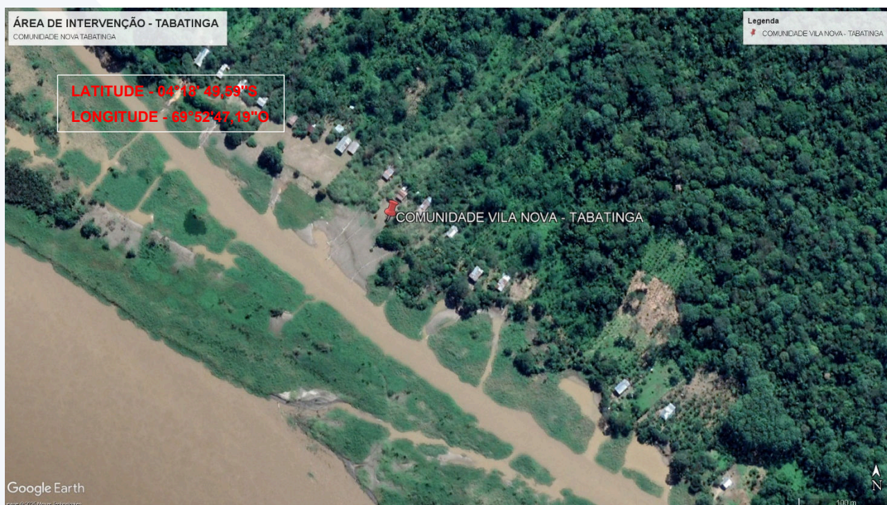
Imagem 5: Localização da área de intervenção –Com Vila Nova – Tabatinga/AM.