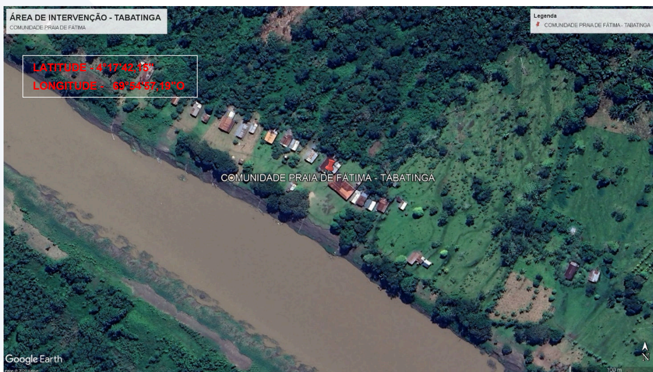
Imagem 3: Localização da área de intervenção – Comunidade Praia de Fátima – Tabatinga/AM.