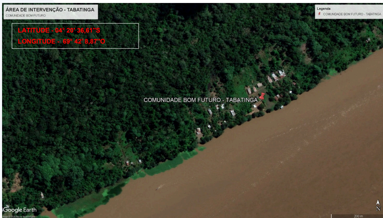
Imagem 1: Localização da área de intervenção – Comunidade Bom Futuro – Tabatinga/AM.