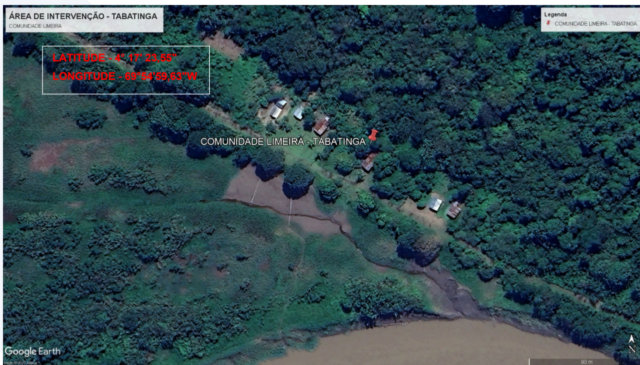
Imagem 2: Localização da área de intervenção – Comunidade Limeira – Tabatinga/AM.