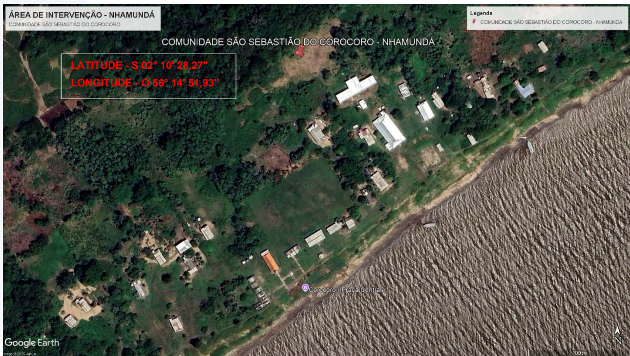
Imagem 2: Localização da área de intervenção – Com São Sebastião Corocoró – Nhamundá/AM.