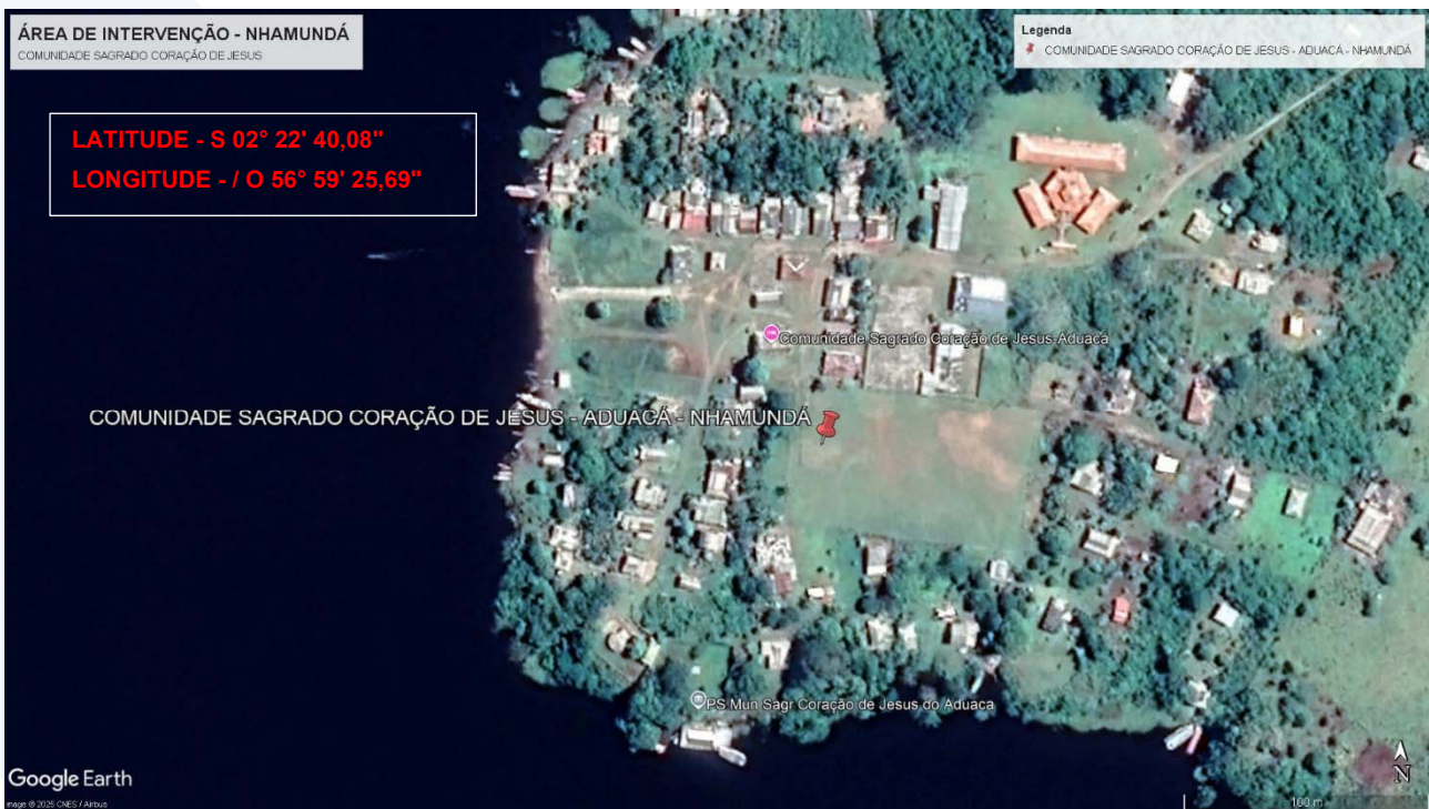
Imagem 1: Localização da área de intervenção –Com Sagrado Coração de Jesus – Nhamundá/AM.