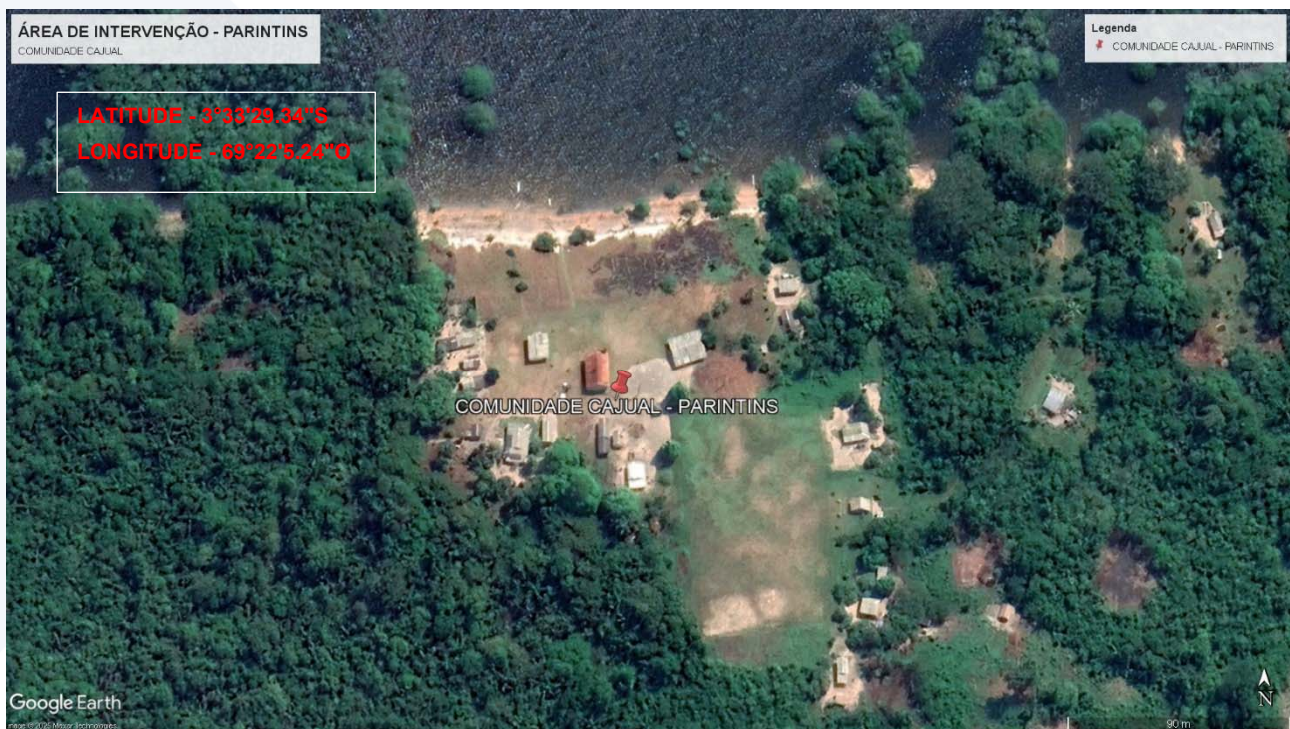
Imagem 3: Localização da área de intervenção – Com Cajual – Parintins/AM.