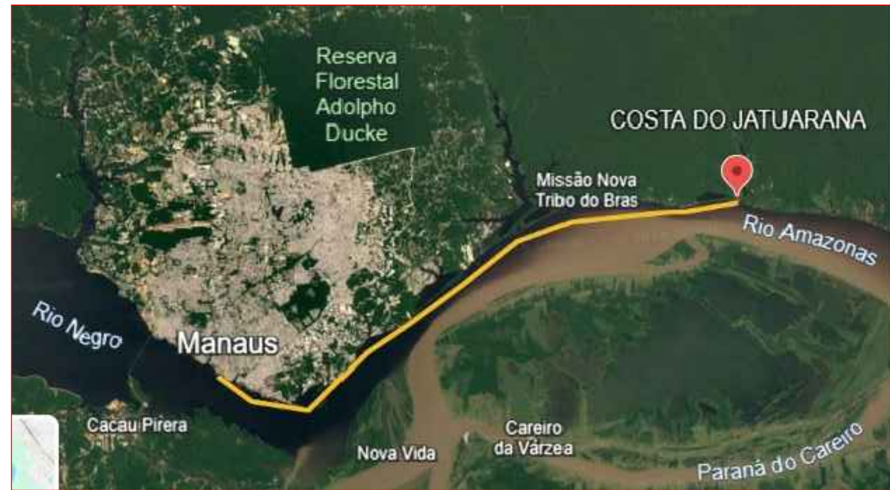
43,4km-Comunidade Costa do Jatuarana - Manaus