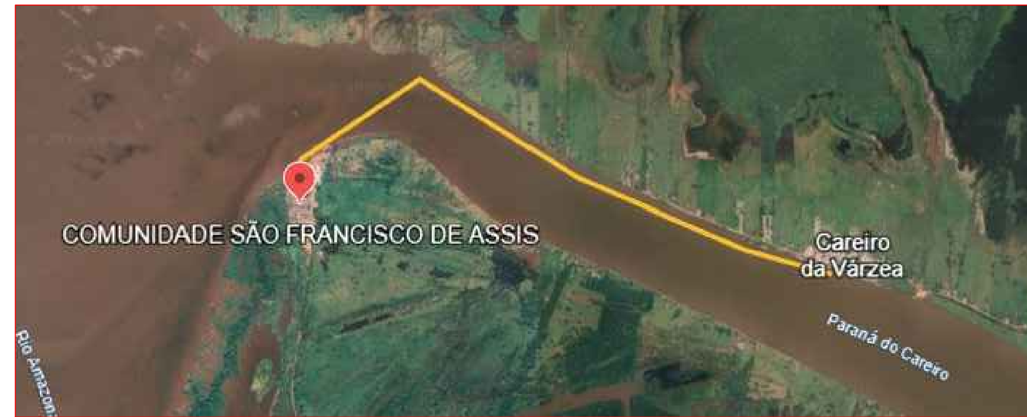
5,54km-Comunidade São Francisco de Assis - Careiro da Varzea