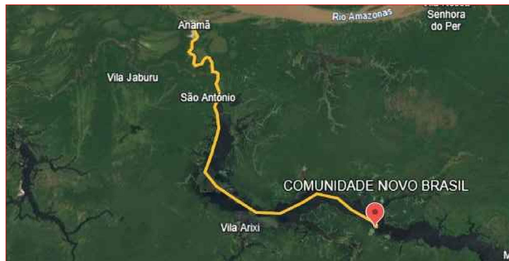
30,65-Comunidade Novo Brasil - Anamá