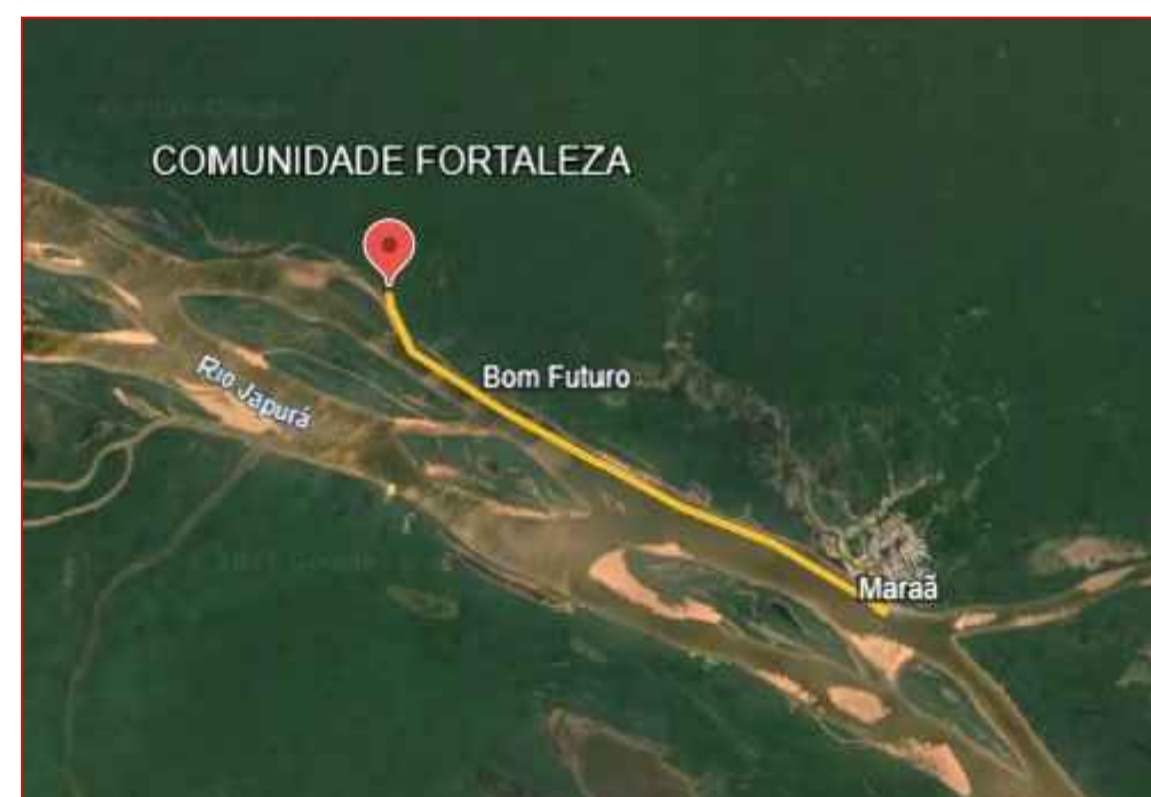
12,29km-Comunidade Fortaleza - Maraã