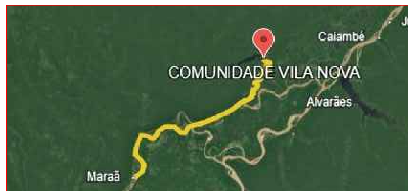
103,01km-Comunidade Vila Nova - Maraã