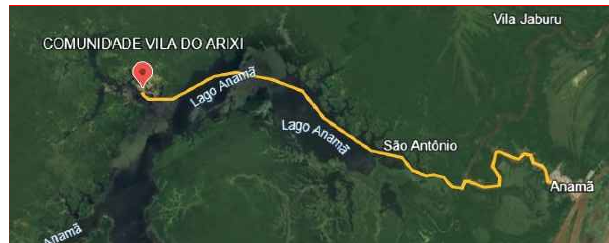
19,54-Comunidade Vila do Arixi - Anamá