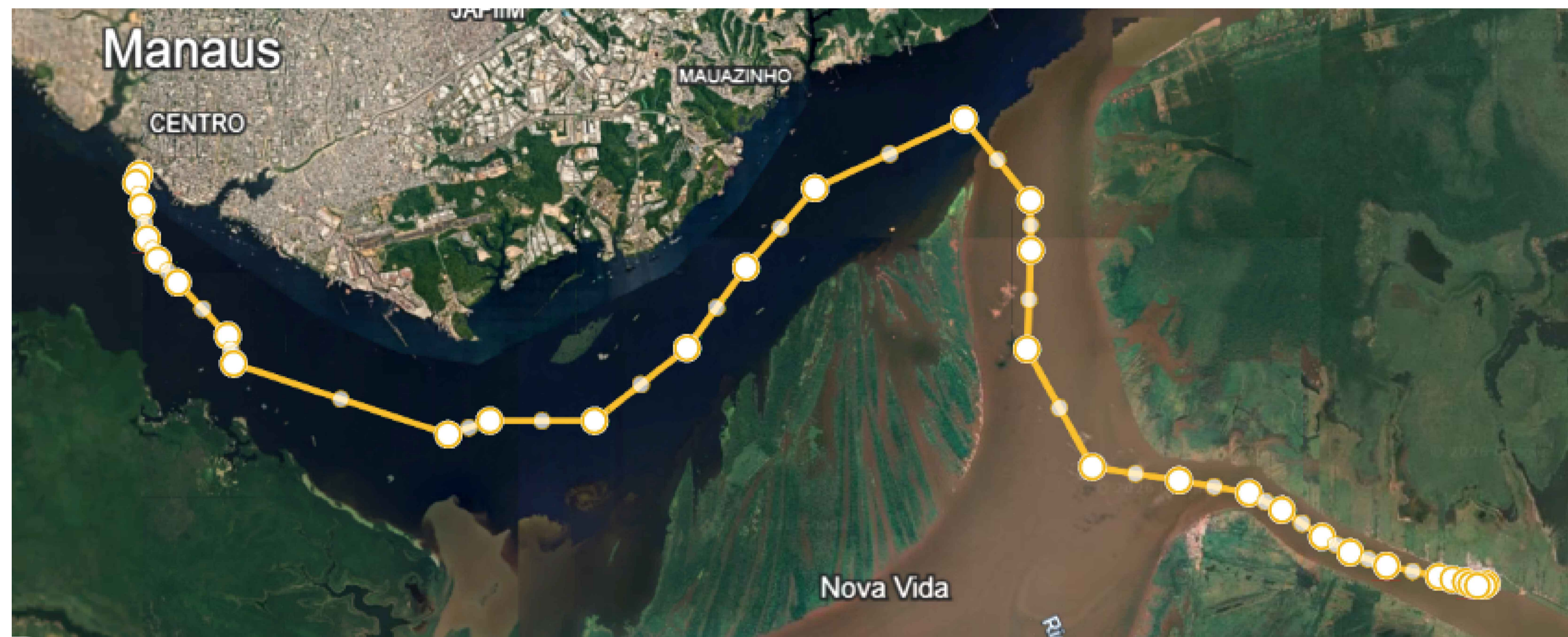
32m-Manaus/Carreio da Varzea