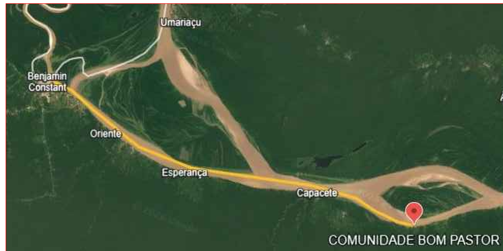
44,01km-Comunidade Bom Pastor - Benjamin Constant