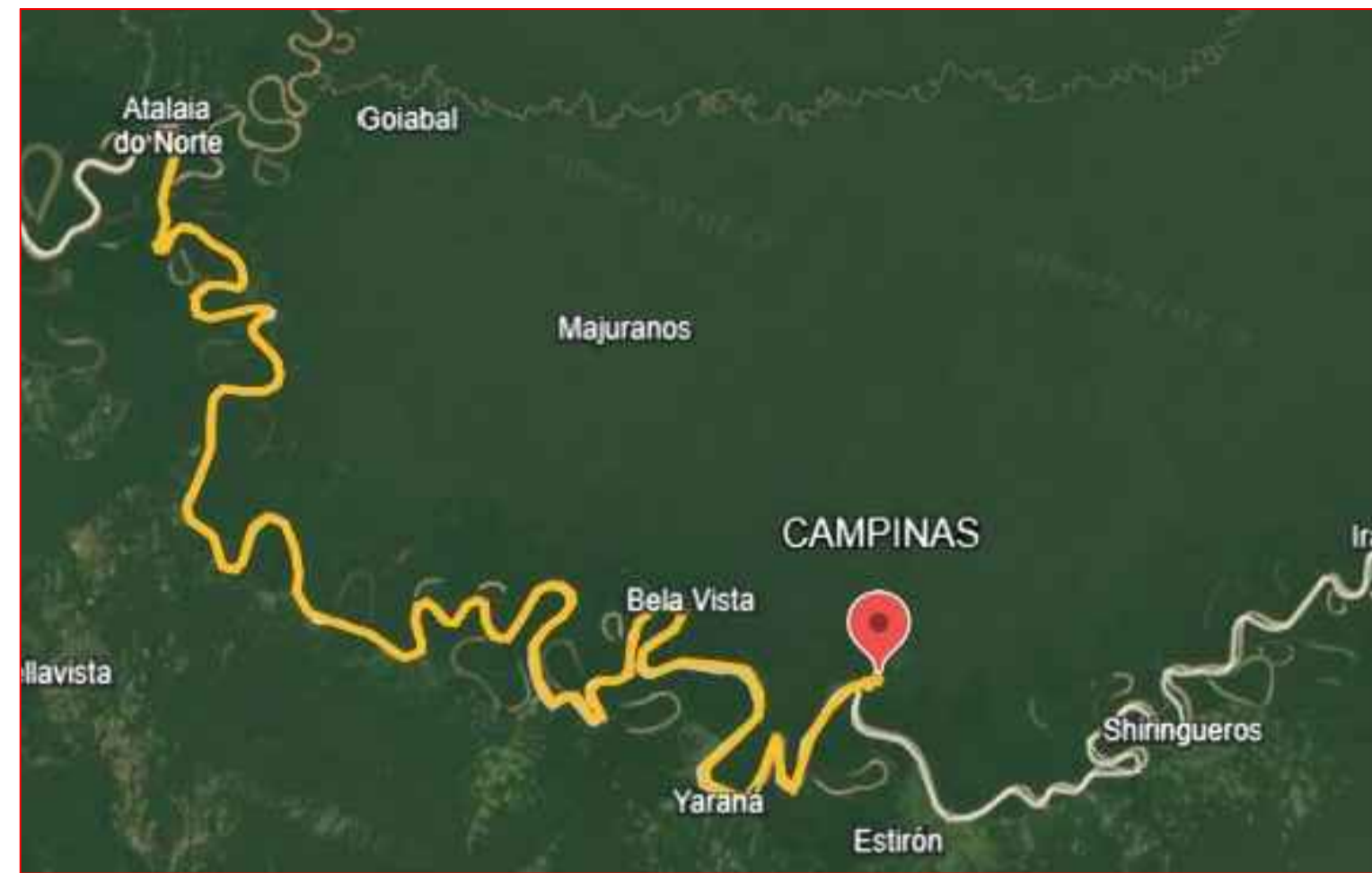
149km-Comunidade Campinas - Atalaia do Norte