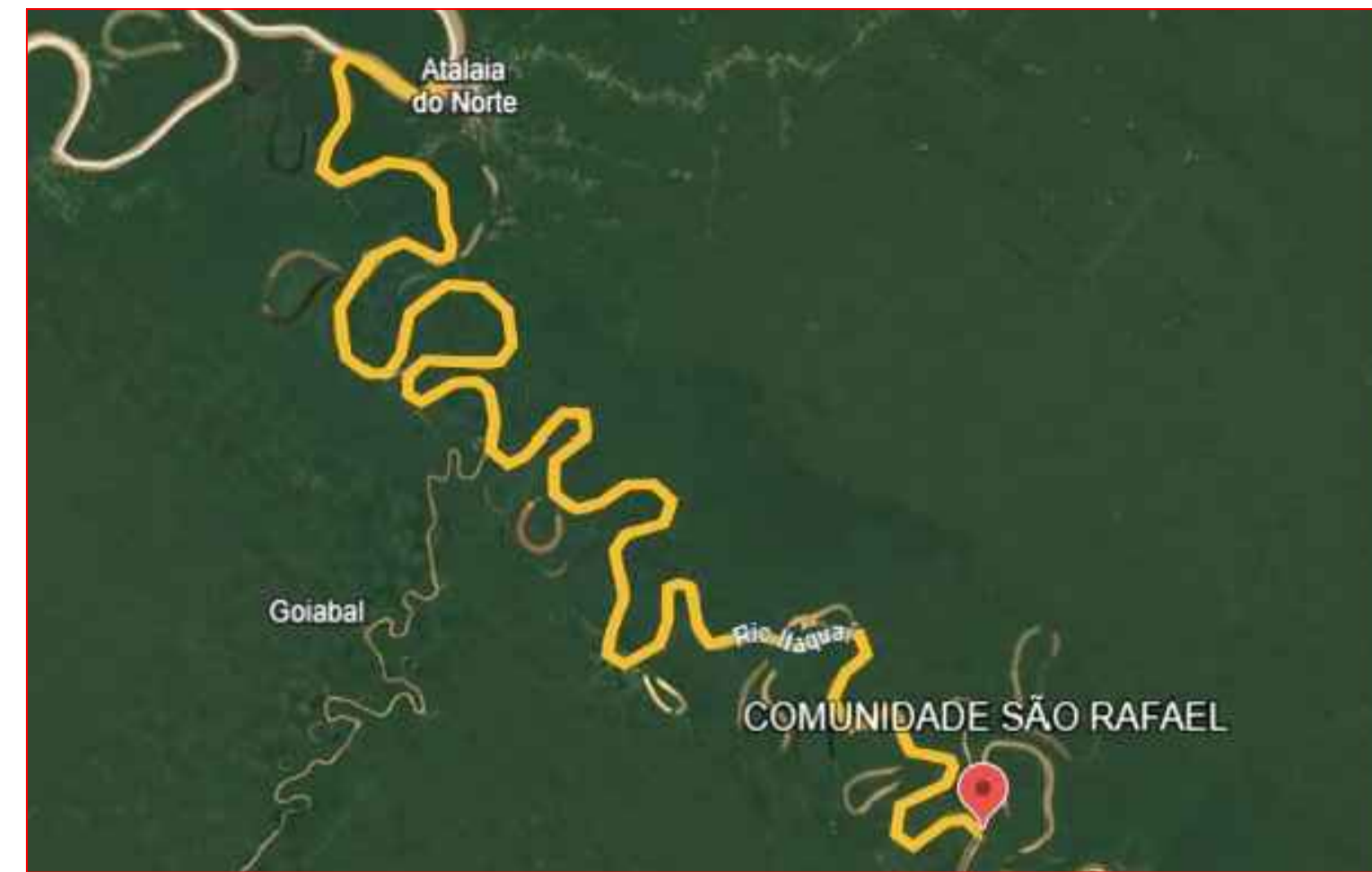
72,74km-Comunidade São Rafael - Atalaia do Norte