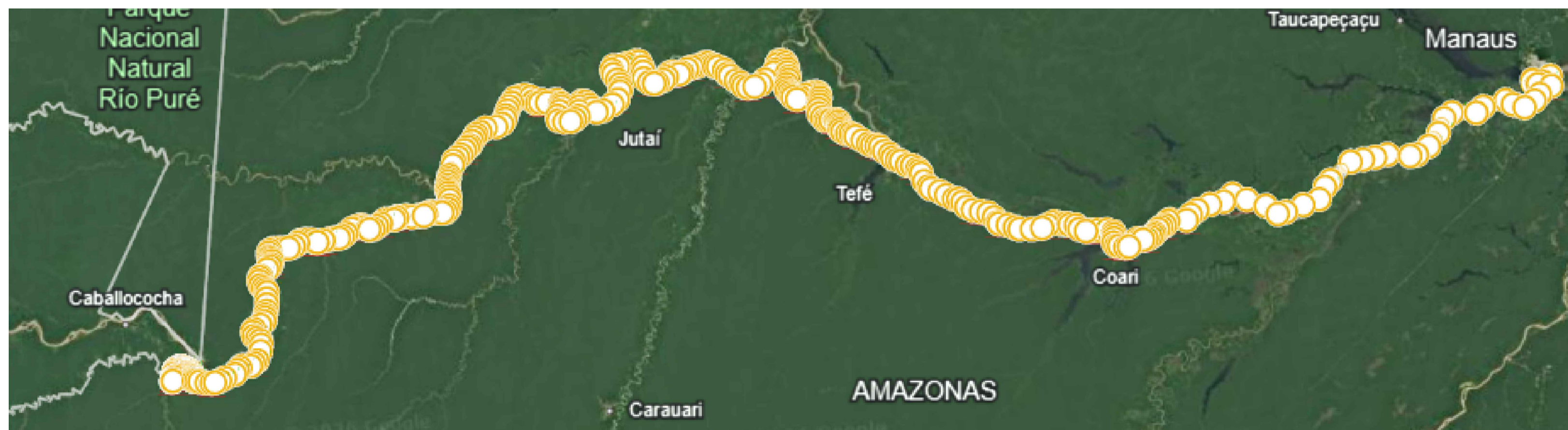
1,618km-Manaus/Atalaia do Norte