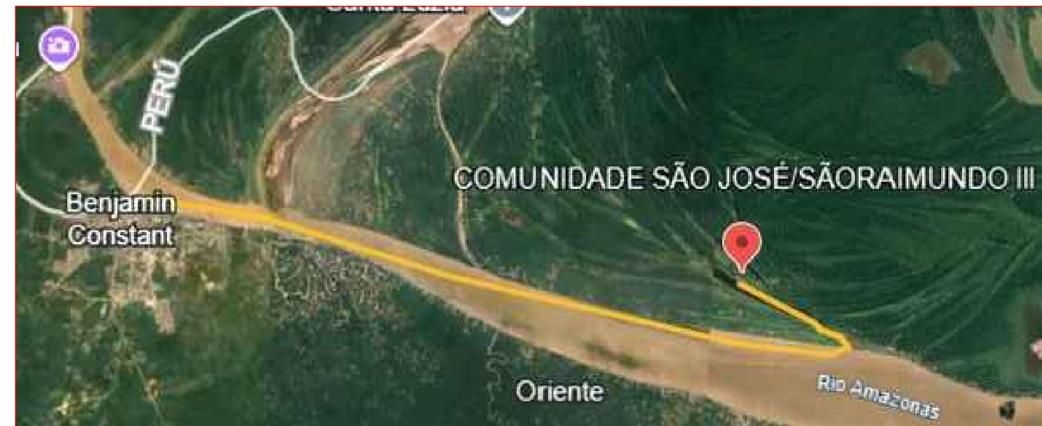
15,68km-Comunidade São José/São Raimundo III - Benjamin Constant