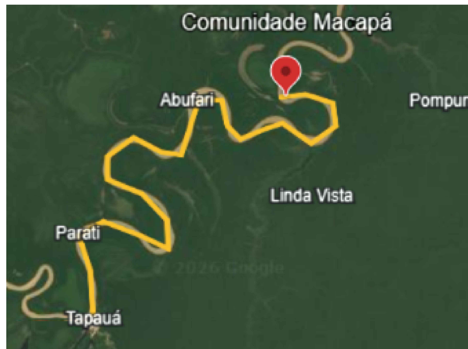
83,16km-Comunidade Macapá - Tapauá