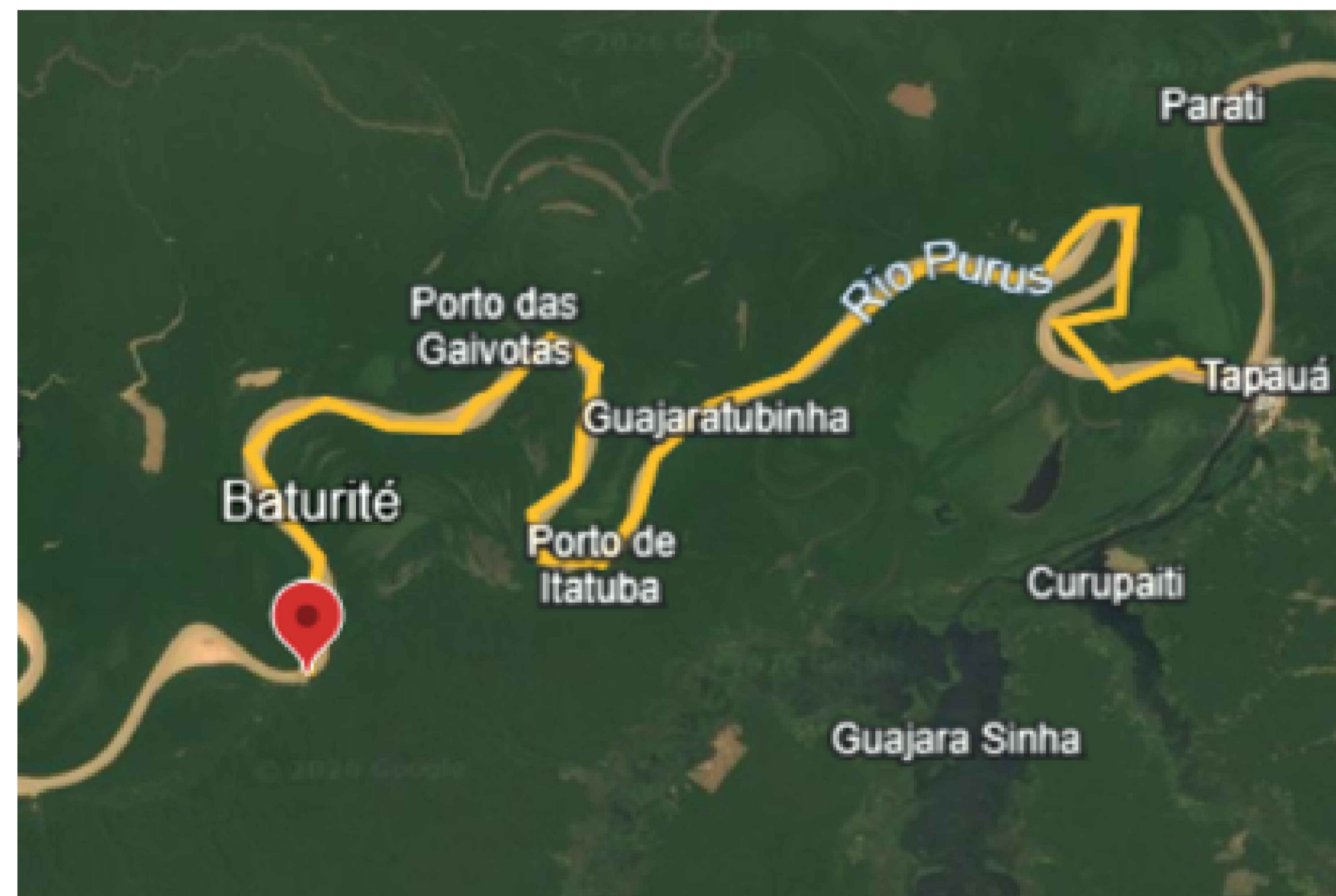
74,36km-Comunidade Baturité - Tapauá