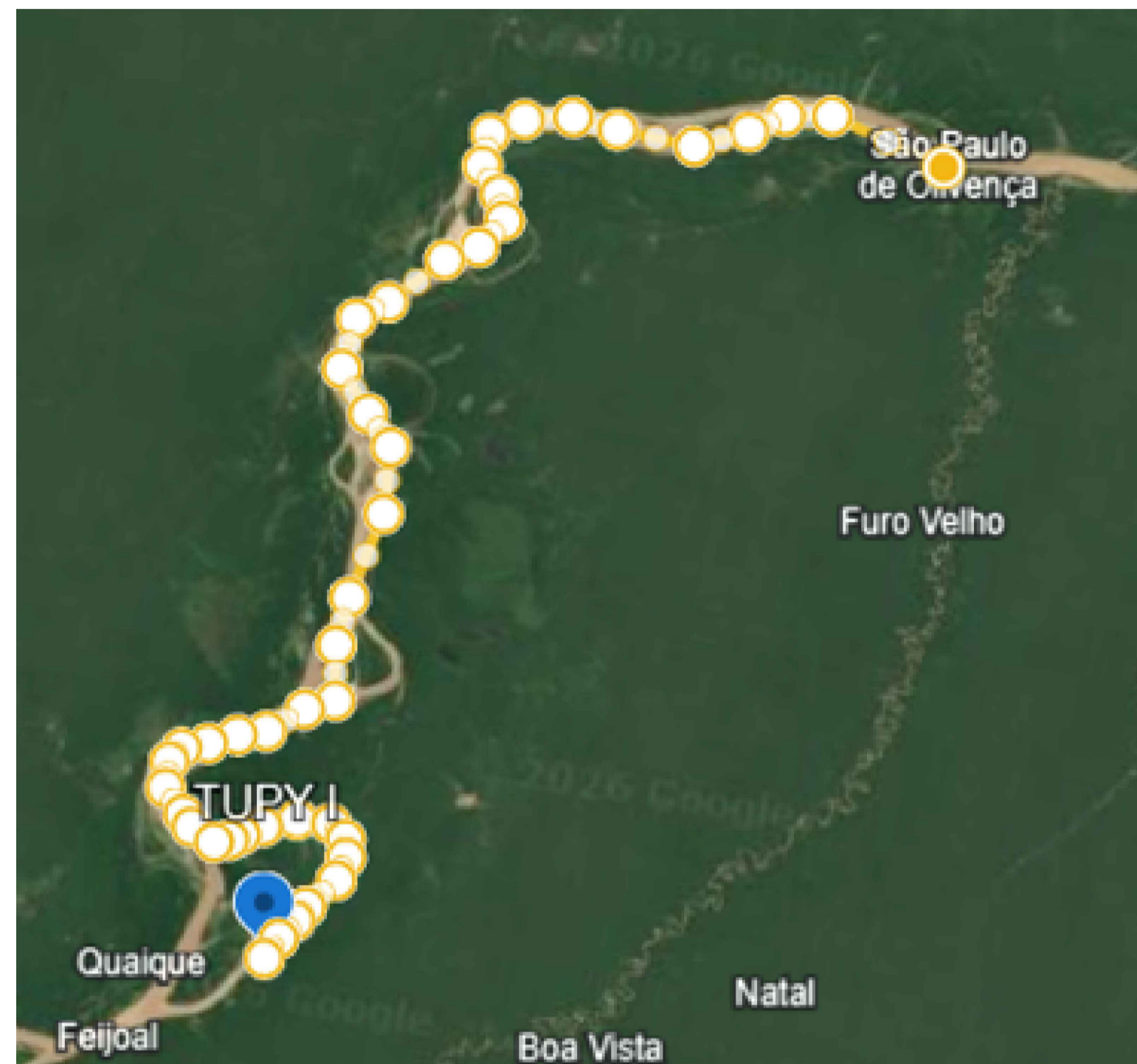
161,65km-Comunidade Tupy - São Paulo de Olivença