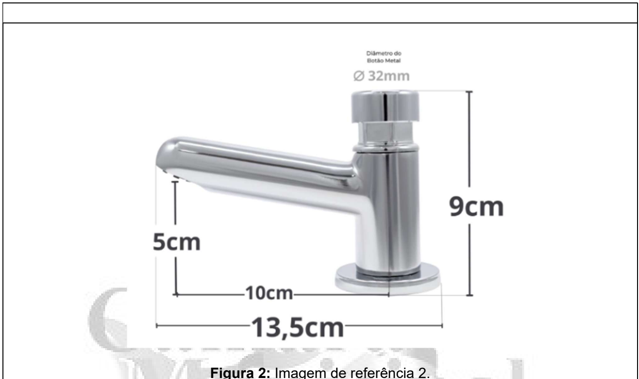
Figura 2: Imagem de referência 2.

São José do Rio Preto, 15 de maio de 2026.