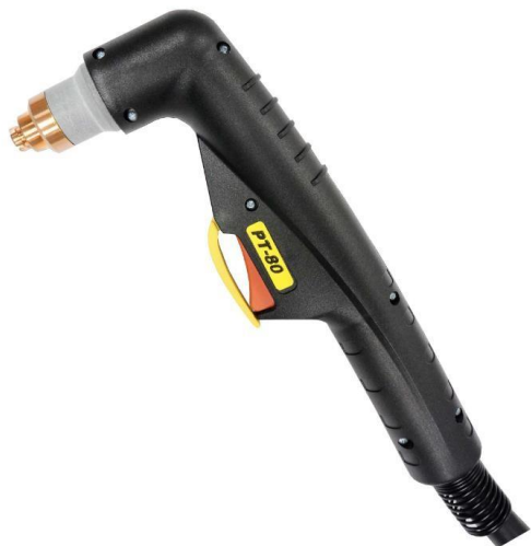
Figura 3 Tocha para equipamento MaxxiCut

2.2.7.1. Tocha para equipamento Maxxi CUT 60. Código do produto 30278541.