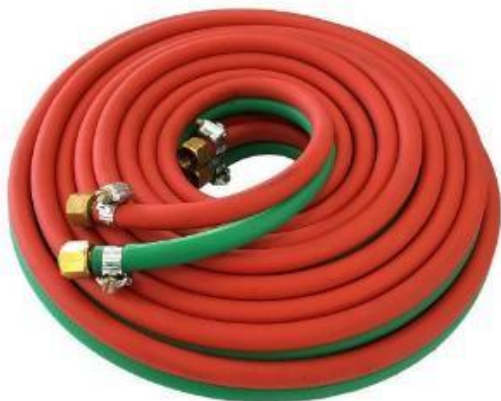
Figura 1 mangueira de solda a ser adquirido