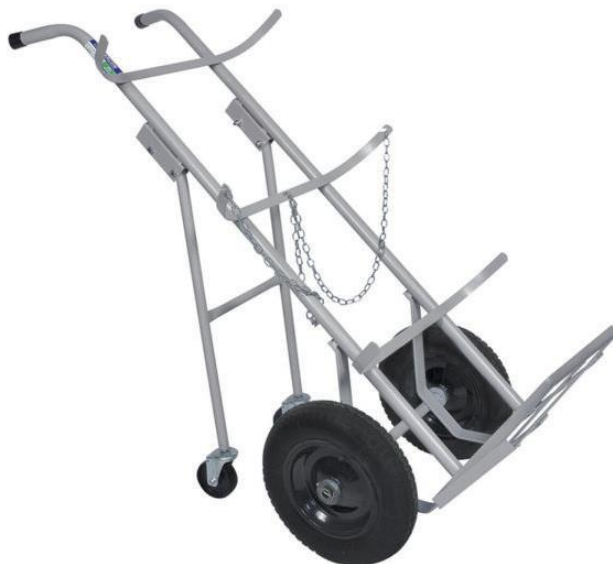
Figura 2 carro de transporte de cilindros

2.2.6.3. Deve possuir corrente para amarração dos cilindros.