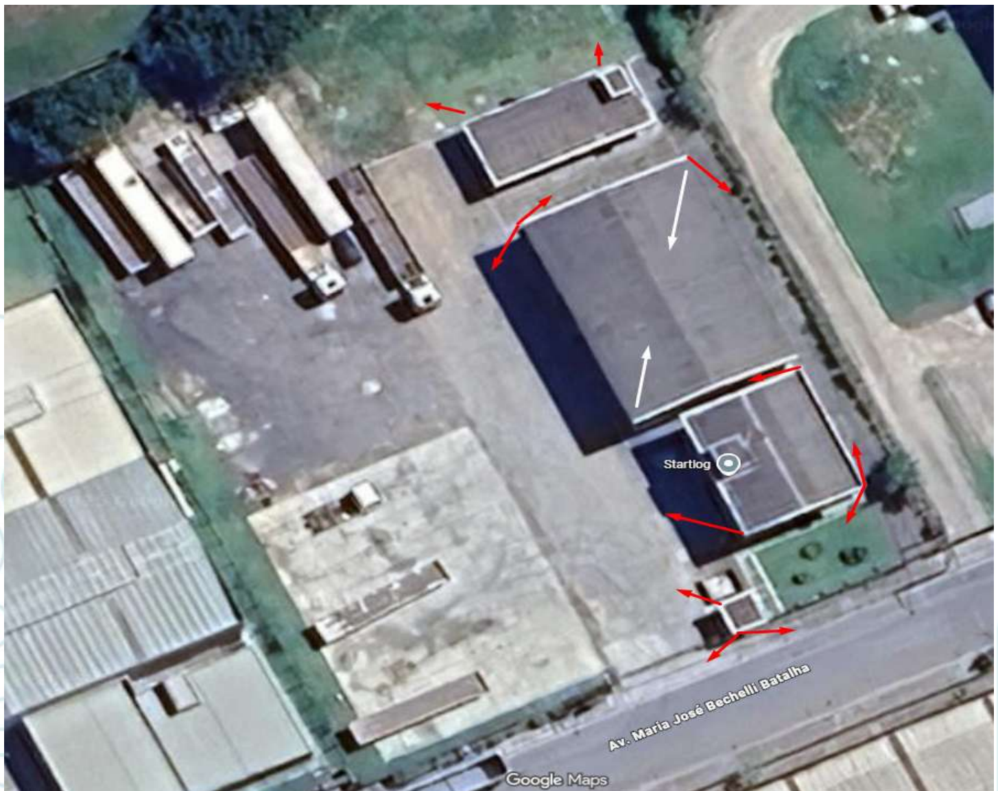
Mapa de localização das câmeras: