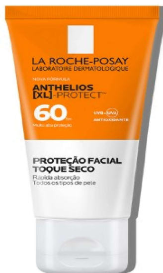
Imagem do modelo