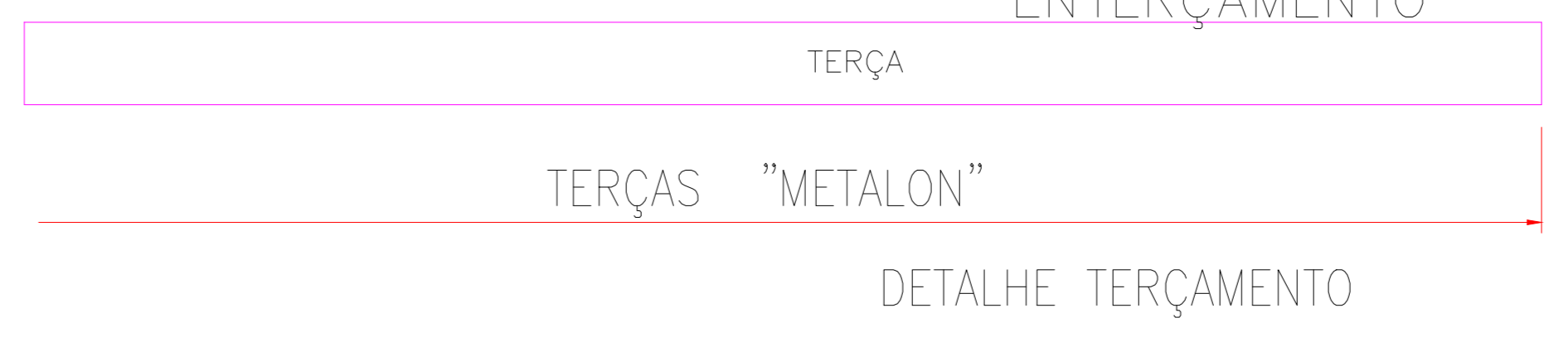
PLANTA BAIXA DO ENTERÇAMENTO

BANZO SUPERIOR : UE 150X60X20 #2.25mm BANZO INFERIOR : U 150X60 #2.65mm DIAGONAIS e MONTANTES: U 75X40 #2.25mm