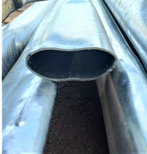
Foto 03 – achatamento na extremidade superior do poste em aço, vista da seção transversal.