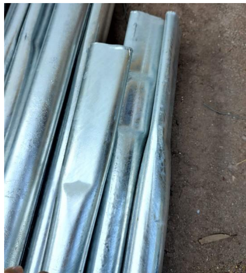
Foto 04 – achatamento com extensão de 26 cm na extremidade superior do poste.