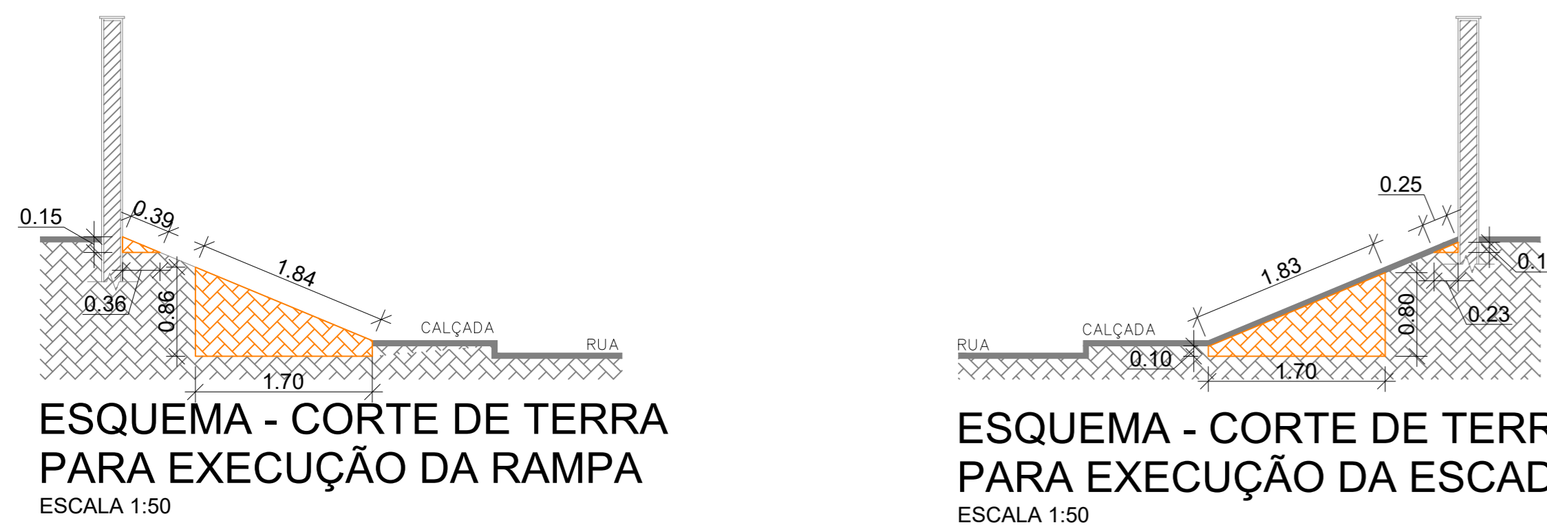
ESQUEMA - CORTE DE TERRA PARA EXECUÇÃO DA RAMPA ESCALA 1:50