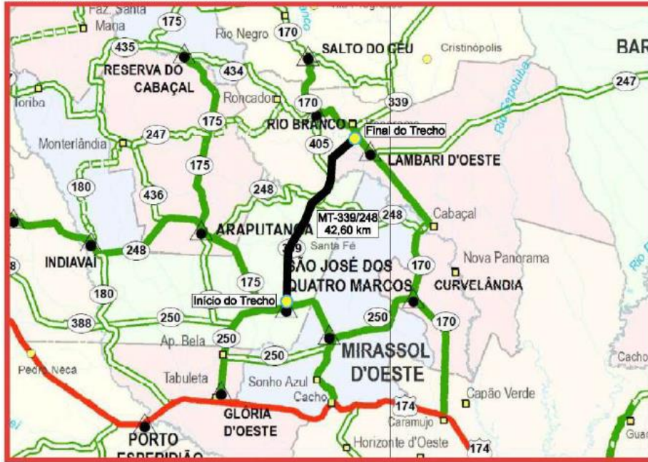
Mapa de situação – Implantação e pavimentação do da Rodovia MT-339 e MT-248.

Início do Trecho: 15° 37' 0.09" S / 58° 10' 40.49" W Final do Trecho: 15° 17' 27.95" S / 58° 1' 43.79" W