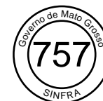
RELATÓRIO DE CONSOLIDAÇÃO DOS CUSTOS DE MÃO DE OBRA Tabela 01 - Consolidação dos custos de mão de obra - Engenharia Consultiva - mês de referência: OUT/2025