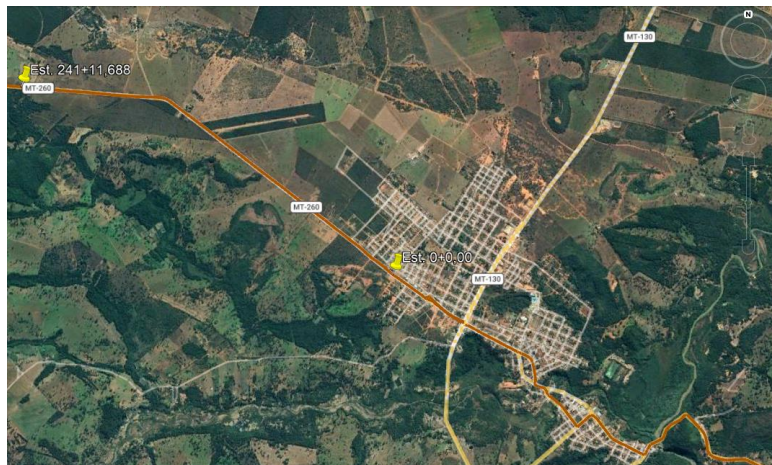
Mapa de situação – Implantação e pavimentação da Rodovia MT-260.