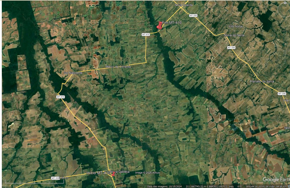
Mapa de situação – Implantação e pavimentação da Rodovia MT-410.