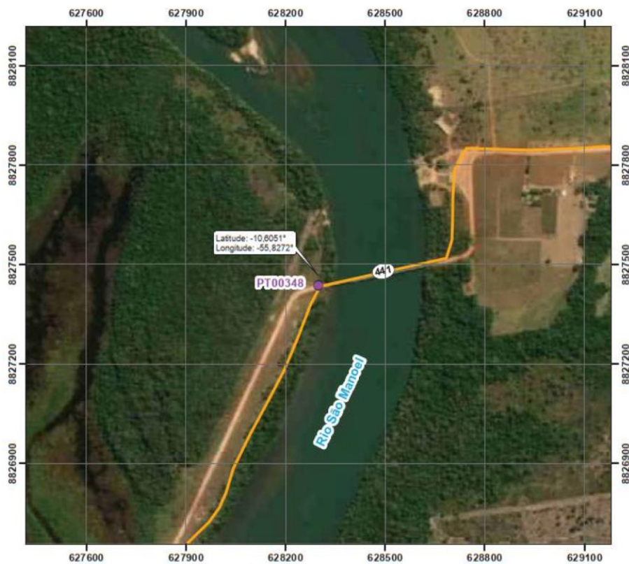
Mapa de Situação – Lote 01: Ponte sobre o Rio Teles Pires (PT00348).