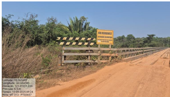
Latitude: -10.365392 Longitude: -60.620445 Elevação: 121.314110 m Precisão: 6.5 m Tempo: 13-09-2025 09:24 Nota: MT 313 - PT02657