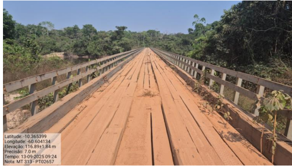
Latitude: -10.365399 Longitude: -60.624134 Elevação: 116.891184 m Precisão: 7.0 m Tempo: 13-09-2025 09:24 Nota: MT 313 - PT02657