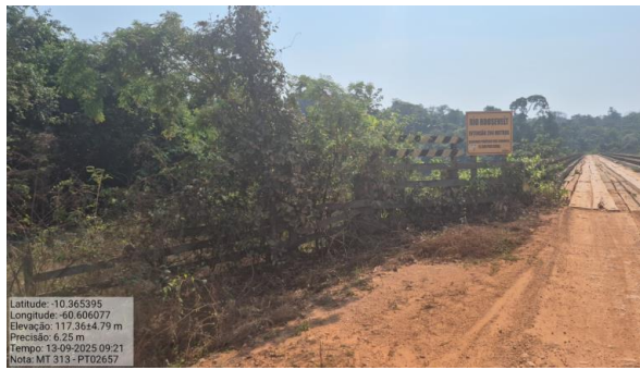
Latitude: -10.365395 Longitude: -60.606077 Elevação: 117.264479 m Precisão: 6.25 m Tempo: 13-09-2025 09:21 Nota: MT 313 - PT02657