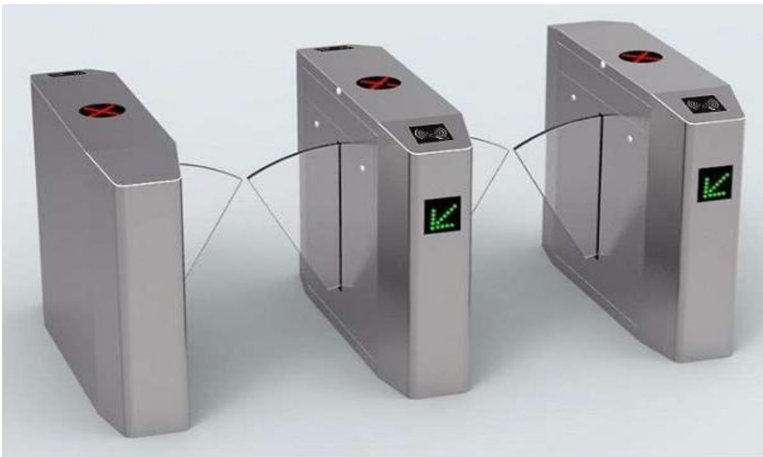
Foto 3 - Modelo 3 - Sugestão de catraca

- ALESP - Documento assinado digitalmente