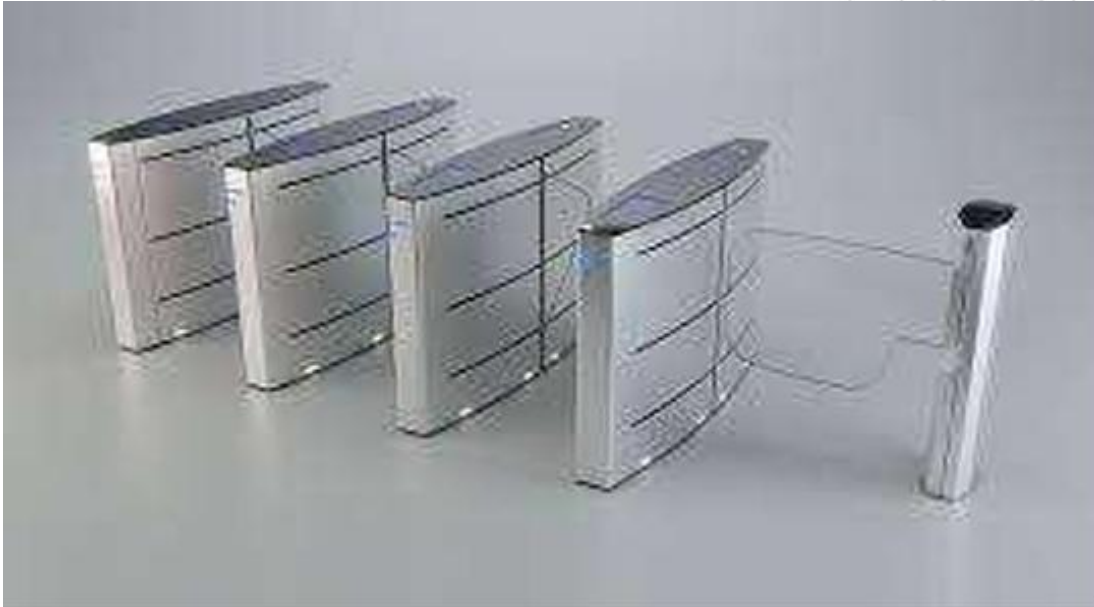
Foto 2 - Modelo 2 - Sugestão de catraca