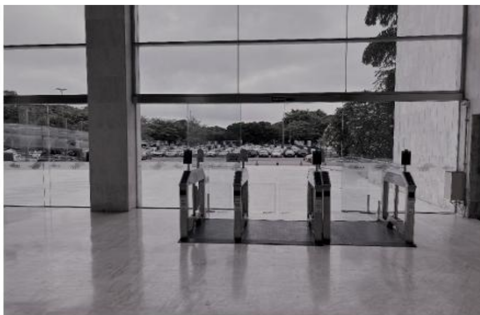
Posto alfa 4 - Saída do Estacionamento dos servidores