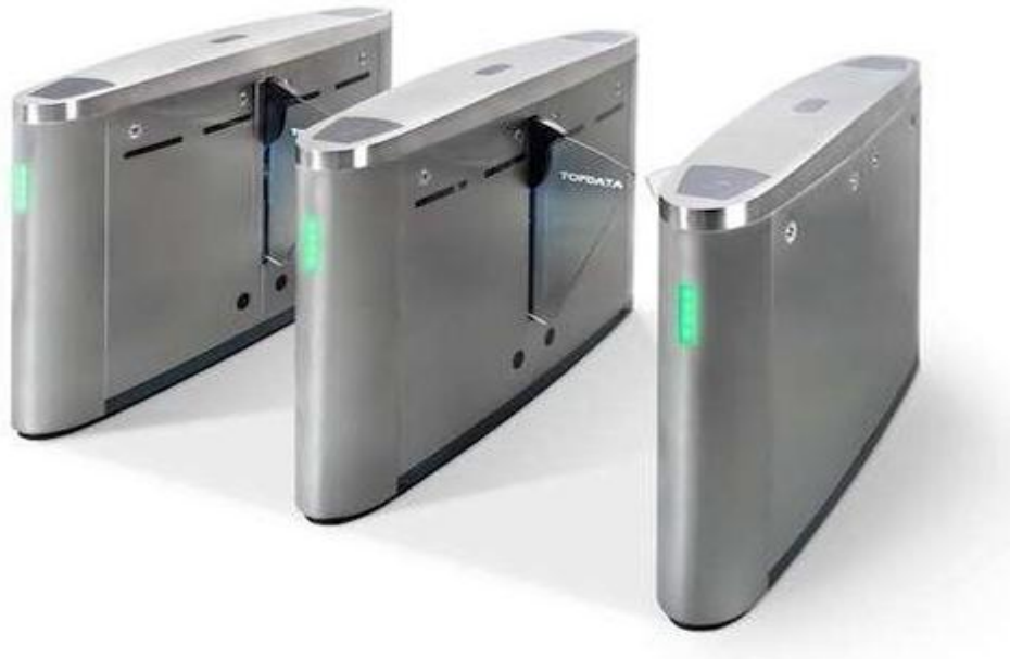
Foto 4 - Modelo 4 - Sugestão de catraca