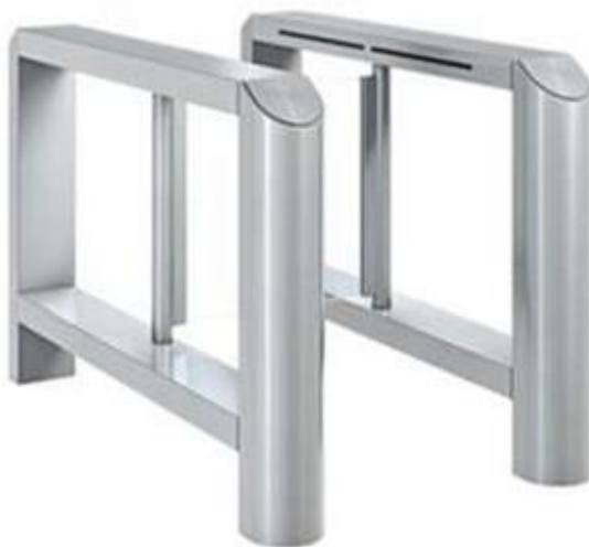
Foto 1 - Modelo 1 - Sugestão de catraca

ASSEMBLEIA LEGISLATIVA DO ESTADO DE SÃO PAULO