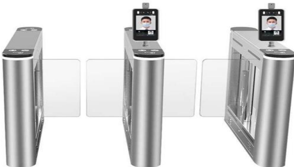
1 - Modelo e posicionamento sugestivo do dispositivo de reconhecimento