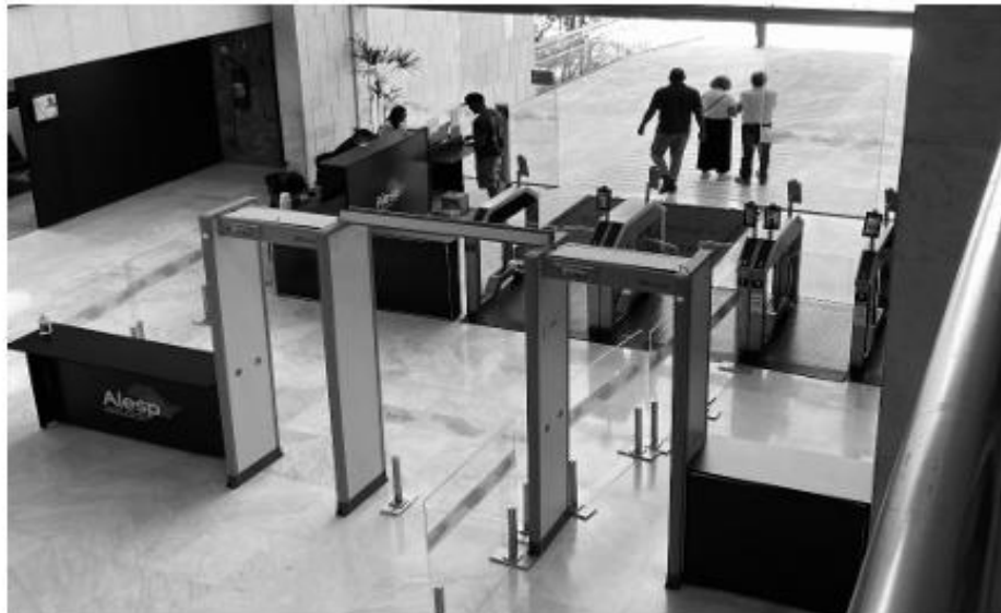
Posto Alfa 3 - Acesso de Pedestres da Avenida Pedro Álvares Cabral

DEPARTAMENTO DE INFRAESTRUTURA/DIVISÃO DE CONSERVAÇÃO E SERVIÇOS