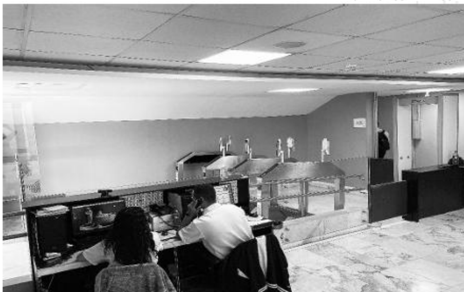
Posto Alfa 4 - Entrada do Estacionamento dos servidores