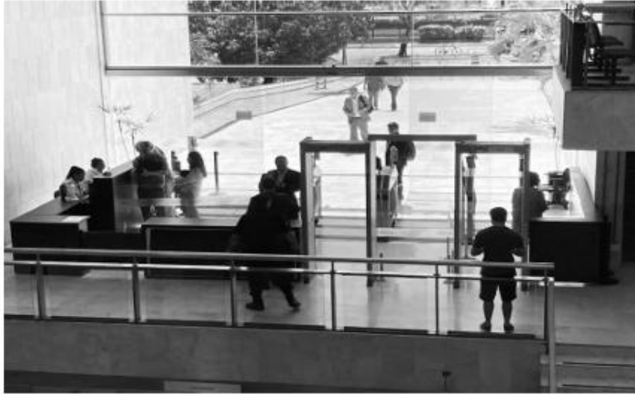
Posto Alfa 2 - Acesso de Pedestres da Rua Sargento Mário Kozel Filho

ASSEMBLEIA LEGISLATIVA DO ESTADO DE SÃO PAULO