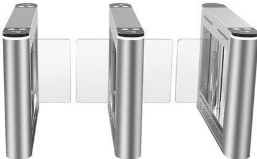
Foto 5 - Modelo 5 - Sugestão de catraca