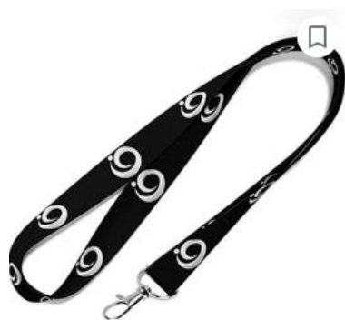
Cordão Personalizado Para Crachá Com Mosquete