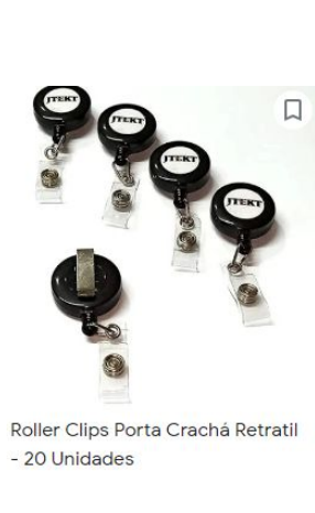
Roller Clips Porta Crachá Retrátil - 20 Unidades