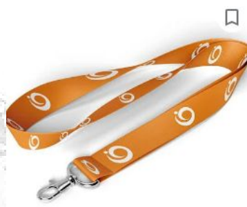
Cordão 20mm Personalizado Para Crachá Com Mosquete