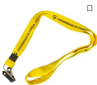
Cordão Para Crachá