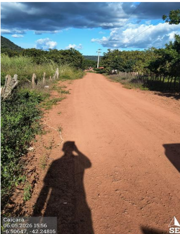
Caçara 06.05.2026 15:56 -6.50647, -42.24816