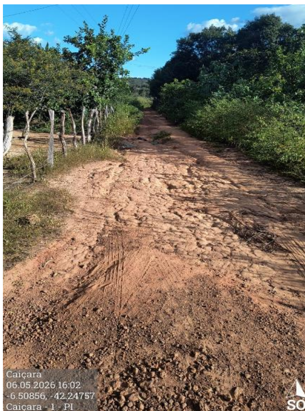
Caçara 06.05.2026 16:02 -6.50856, -42.24757 Caçara - I - PI