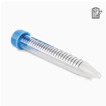
Tubo Para Centrifuga Tipo Falcon 15ml Pacote Com 25 Unidades Kasvi