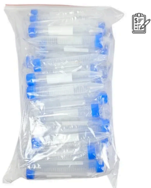
Tubo para Centrifuga Tipo Falcon 15ml Estéril Embalagem Individual Pacote co...