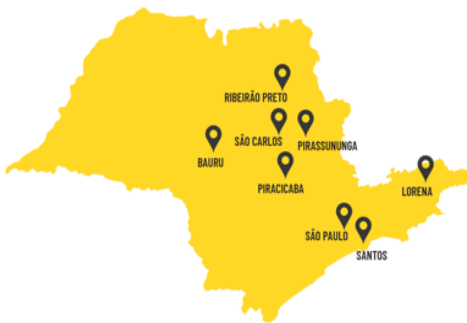
Figura 1 – Cidades dos principais campi da USP

Para desenvolver suas atividades, a USP conta com diversos campi distribuídos pelas cidades de São Paulo, Bauru, Lorena, Piracicaba, Pirassununga, Ribeirão Preto, Santos e São Carlos, além de unidades de ensino, museus e centros de pesquisa em diferentes municípios. Entre eles, destacam-se os espaços costeiros vinculados ao Instituto Oceanográfico em Cananéia-Iguape e Ubatuba, o Centro de Biologia Marinha (CEBIMar), localizado em São Sebastião, e uma unidade de pesquisa em Montenegro, Rondônia.