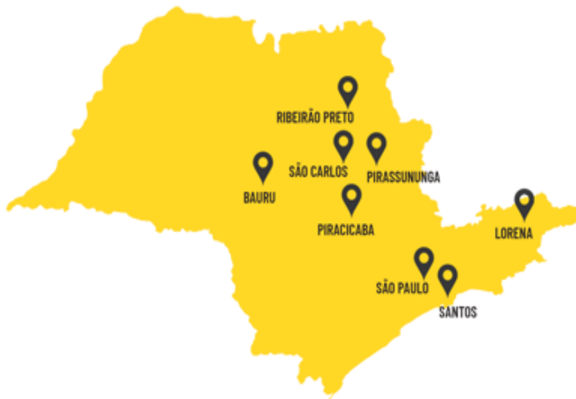
Figura 1 – Cidades dos principais campi da USP

Oceanográfico em Cananéia-Iguape e Ubatuba, o Centro de Biologia Marinha (CEBIMar), localizado em São Sebastião, e uma unidade de pesquisa em Montenegro, Rondônia.