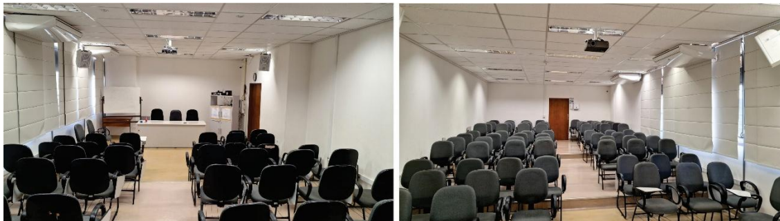
Fotos do Anfiteatro IV da FORP.