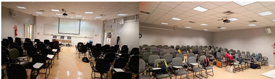
Foto: Anfiteatro III da FORP.