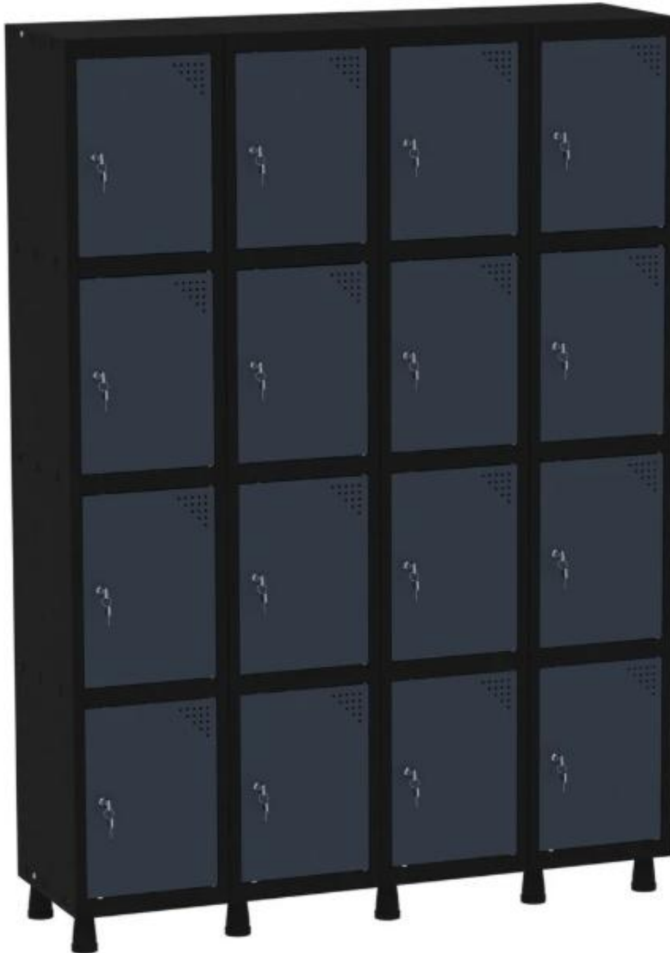
Figura 1: Imagem ilustrativa do armário guarda-volumes