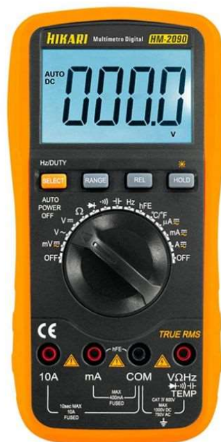
Figura 2: Hikari HM-2090.

b) Multímetro Digital True RMS Hikari HM-2090