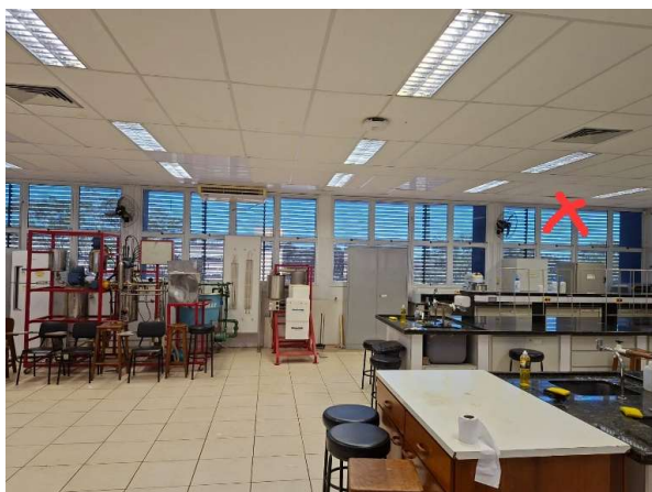
Sala 17 do Bloco 10 da Exatas – FFCLRP