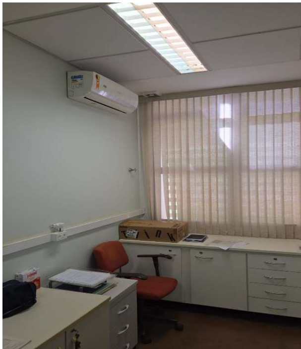
Sala 2 - Bloco B – substituição