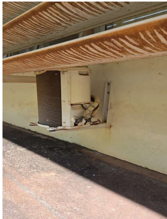
Sala 2 – Bloco B – substituição