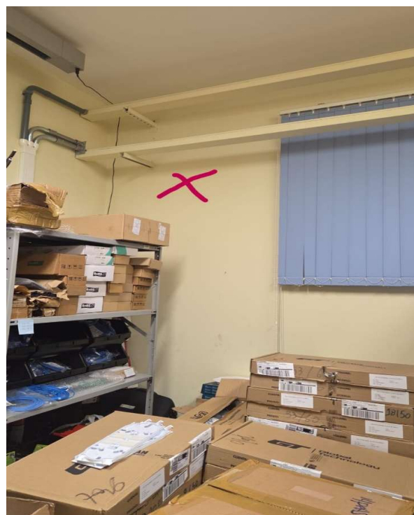
Sala do Donizete – aparelho novo - 12 k BTUS SPLIT/parede