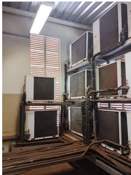
Sala localizada no telhado do CeTI-RP onde ficam todas as condensadores dos aparelhos de ar condicionado tipo Cassete