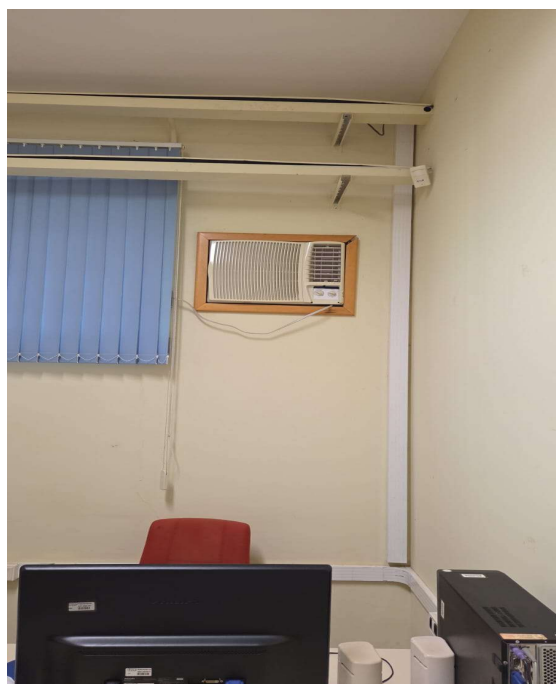
Sala do Donizete, substituição por 12 k BTUS SPLIT/parede