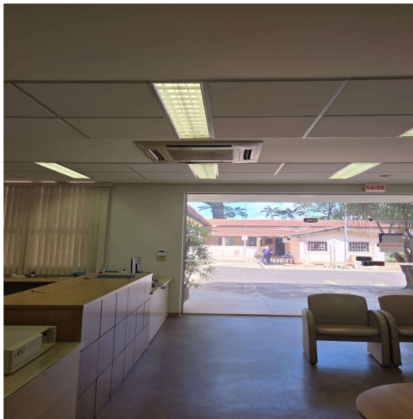
Recepção do Bloco B do CeTI-RP