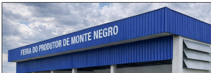
Fechamento Frontal abaixo do existente e lateral com telhas metálica – Imagem Ilustrativa

Os serviços compreendem o fornecimento de todos os materiais, mão de obra especializada, equipamentos, transporte, montagem, içamento, pintura, fixações e demais procedimentos necessários à perfeita execução do objeto, demonstrado a seguir: