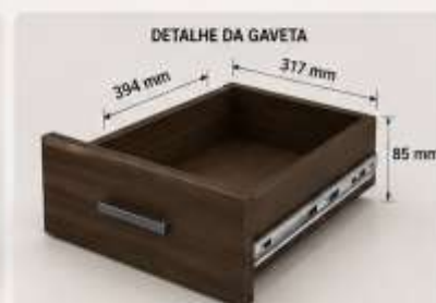
DETALHE DA GAVETA