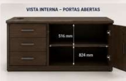
VISTA INTERNA – PORTAS ABERTAS