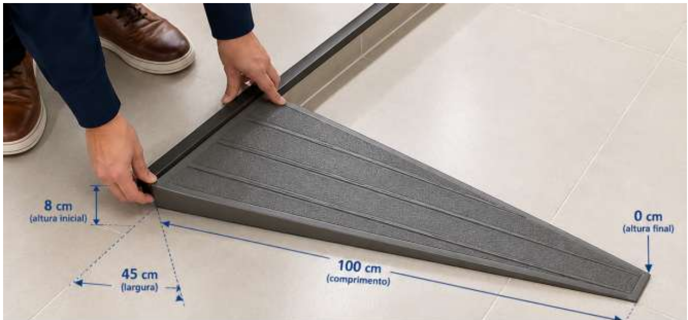
VISTA SUPERIOR (PLANTA)