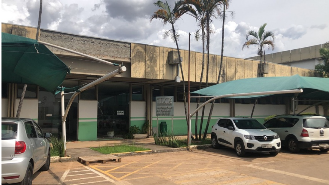
LQA - Contagem/MG SEI Nº.: 1300.01.0000237/2025-16