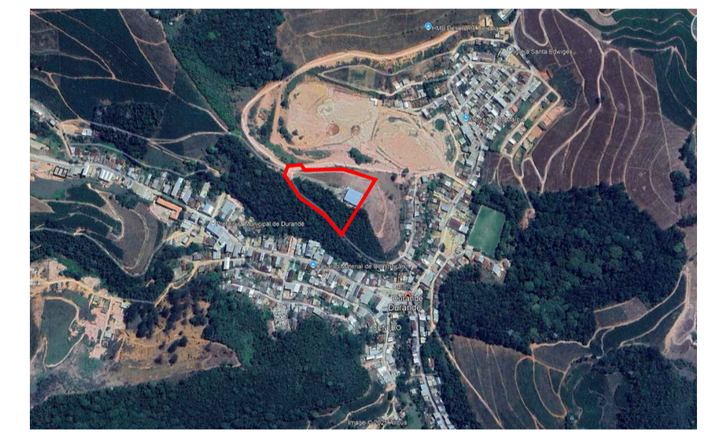
IMAGEM 01 - IMAGEM PANORÂMICA DA ÁREA VIA Mapeamento AÉREO GOOGLE EARTH

Sistema de Coordenadas Coordenadas Planas U T M Meridiano Central -39°, Fuso -24 Origem das coordenadas: SIRGAS2000 - Elipsóide: GRS-80