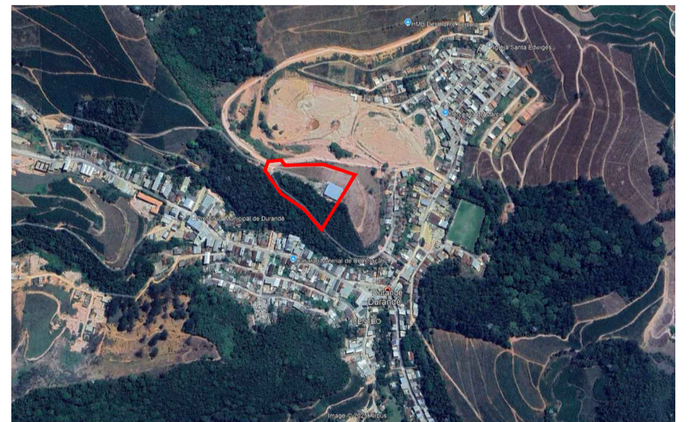
IMAGEM 01 - VAGEM PANORÂMICA DA ÁREA VIA MAFAPAMENTO AÉREO GOOGLE EARTH

Sistema de Coordenadas Coordenadas Planas U T M Meridiano Central -39°, Fuso -24 Origem das coordenadas: SIRGAS2000 - Elipsóide: GRS-80