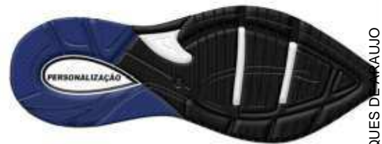
MODELO DE TÊNIS COM AMARRAS EM CARDARÇO