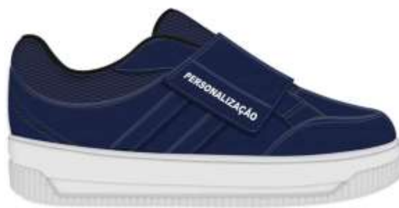
MODELO TÊNIS BEBÊ FECHAMENTO EM VELCRO 1