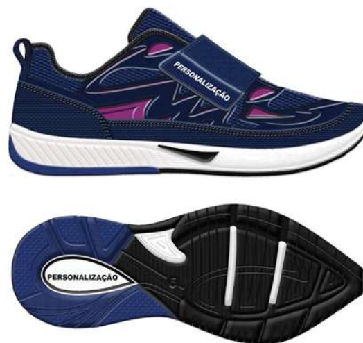
MODELO DE TÊNIS COM AMARRAÇÃO EM VELCRO 1