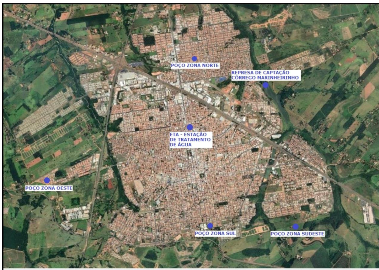
Figura 2 - Localização dos sistemas de captação e distribuição de água